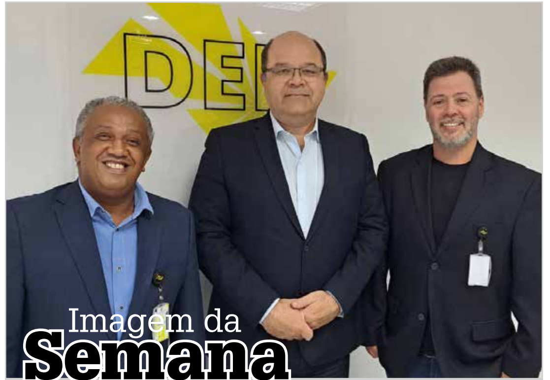
Imagem da Semana

Ainda em tempo, enquanto 2024 bate à porta, também cabe uma reflexão sobre o que vivemos neste ano, afinal, o olhar crítico para o passado é fundamental para compreender o presente, o que, por sua vez, é indispensável para projetar o futuro. Em busca das melhores histórias, que 2024 traga muita saúde, paz, alegria e prosperidade!