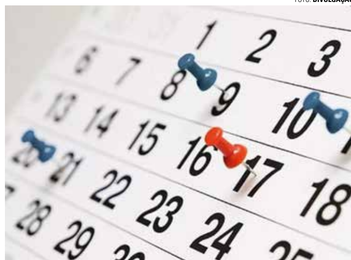
ANO BISSEXTO - Com um dia a mais em fevereiro em decorrência do ano bissexto, alguns feriados foram empurrados para o final de semana

Apesar disso, há pelo menos quatro pontes, começando por esta segunda-feira (1), feriado nacional da Confraternização Universal. Outras opções são os o feriado nacional da Paixão de Cristo (29 de março, sexta-feira), o feriado municipal de Corpus Christi (30 de maio, quinta-feira,