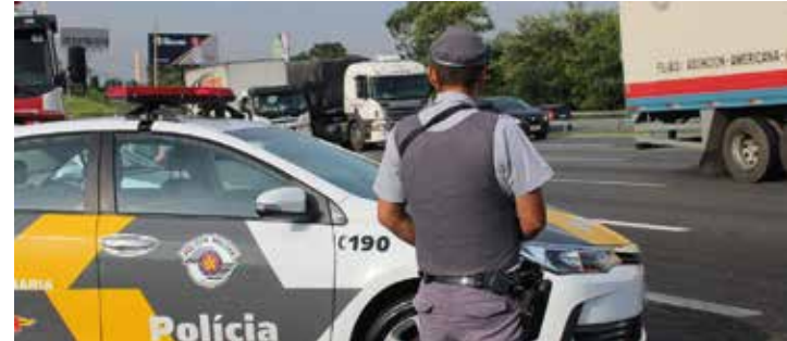
SEGURANÇA - Mais de 3,2 mil agentes devem atuar durante a operação

Um dos focos da ação é a embriaguez ao volante, que está entre as principais causas de acidentes e, conseqüentemente, de