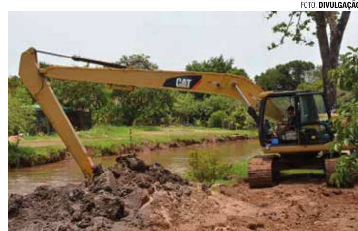
TRABALHO CONTÍNUO - Entre ações adotadas, está o desassoreamento do Rio Lençóis e do Córrego Corvo Branco, que teve início em novembro

ram na Vila Contente, onde 61 casas acabaram alagadas e moradores tiveram seus pertences danificados. Para amenizar o impacto, a Prefeitura Municipal criou um Auxílio Financeiro Emergencial às famílias atingidas. Com