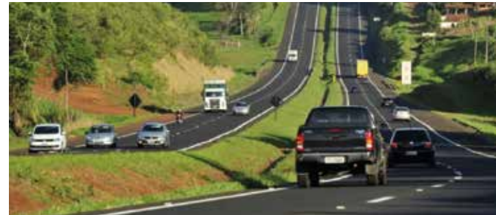
PICO - Maior movimentação de veículos na Marechal Rondon é esperada para este sábado, das 7h às 11h, e na segunda-feira, das 16h às 20h

Para a tranquilidade dos usuários, os Centros de Controles Operacionais das concessionárias, também estão atuando com reforço em suas equipes para o monitoramento e operação de