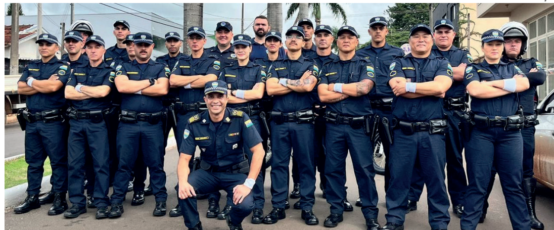
SEGURANÇA - Em um ano de atividade, Guarda Civil Municipal atendeu aproximadamente 355 ocorrências