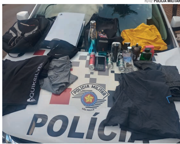
FURTO - Jovens tentaram levar diversos objetos, como roupas e perfumes

Após quase uma hora de busca, os indivíduos foram localizados embaixo de uma vegetação. Acompanhando o adolescente de