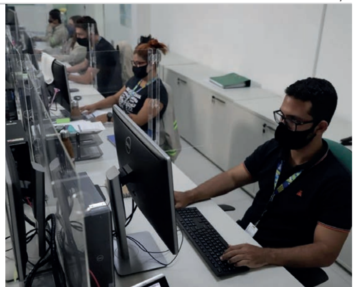
PROCESSO SELETIVO - Companhia está disponibilizando 40 vagas para estudantes de diversas áreas para atuação em Lençóis e outras cidades

De acordo com informações fornecidas pela assessoria de imprensa da empresa, a carga horária para o estágio é de 30 horas semanais, com modelo de trabalho presencial. Entre os benefícios oferecidos aos estudantes