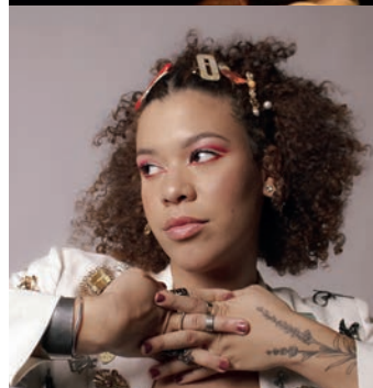
DOSE TRIPLA - Projeto leva ao palco talentosas cantoras e compositoras da região