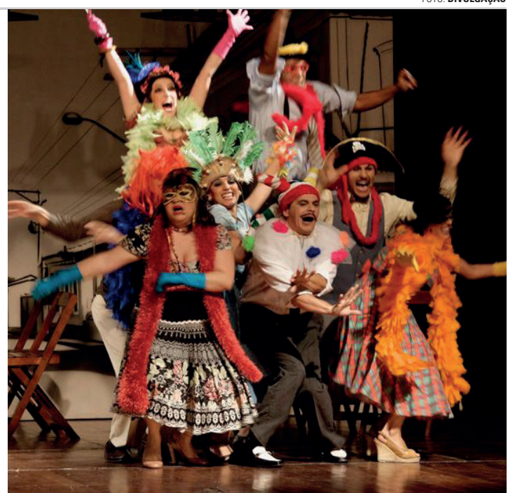
NO RITMO DO SAMBA - Musical propõe o resgate da história do samba paulistano pelas composições do grande Adoniram Barbosa

tiva de 10 anos e cerca de 70 minutos de duração, o musical 'Os Boêmios de Adoniran' tem entrada gratuita. Os ingressos podem ser retirados a partir da segunda-feira (11), na recep-