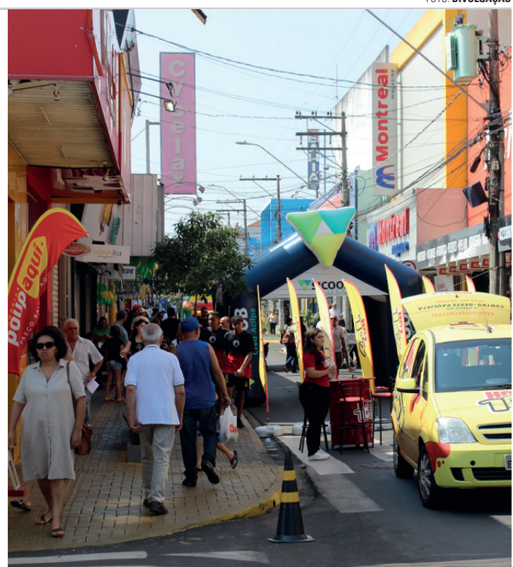
INTERDITADA - Principal rua do comércio fica fechada neste sábado (9)

"Durante a semana, os lojistas devem trabalhar com várias promoções e descontos para atrair os consumidores. Começamos com mais uma ação da Acilpa na Rua Quinze de Novembro, que tem ajudado bastante por gerar muito movimento. A expectativa é de que as lojas registrem um aumento de 20% a 30% em suas vendas em relação a um sábado comum", completa ele, que espera que a