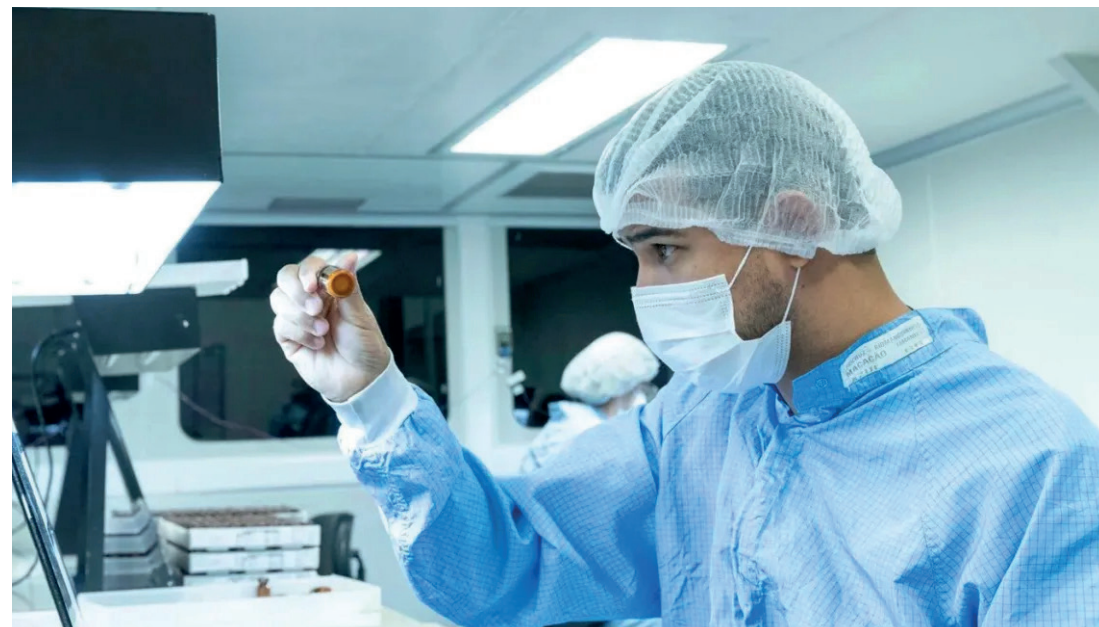
SILENCIOSA - Estimativa aponta que até 2,5 milhões de pessoas podem estar infectadas com HTLV no Brasil