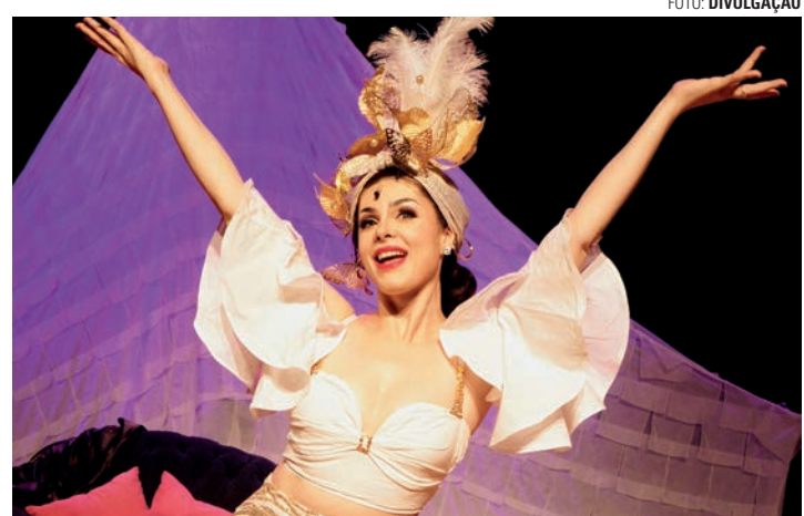
PRA VOCÊ GOSTAR DE MIM - Peça narra episódio incômodo da biografia da artista, que foi hostilizada pelo público em seu retorno ao Rio de Janeiro