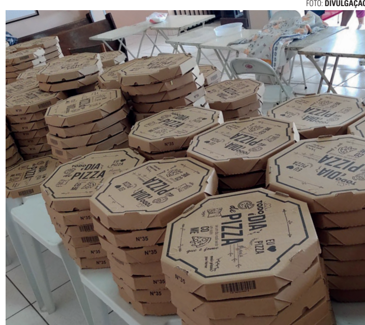
TARDE DA PIZZA - Ação solidária já se tornou uma tradição na paróquia; na foto, entrega de pizzas realizada em no ano passado

Para quem puder colaborar de outra forma, os voluntários também estão precisando de do-