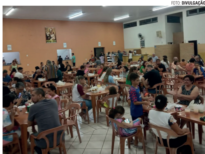
QUERMESSE - Praça de alimentação está funcionando todo sábado e domingo, sempre a partir das 19h, com várias opções de comida e bebida

A diversão segue na quermesse, com a praça de alimentação funcionando todo sábado e domingo, sempre a partir das 19h. A estrutura, montada no salão de festas da paróquia, conta com di-