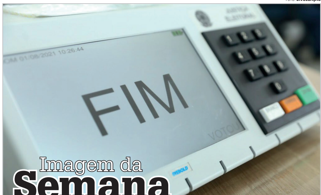
Imagem da Semana

Criar adornos populistas nas falas de palanques, carregar passarinhos em gaiolas para soltá-los em comícios, enfim, enfeitar o verbo com drible linguísticos já não puxam a aclamação das multidões. Promessas mirabolantes não entram na cachola do eleitor. Esse é um alerta para o ano eleitoral em curso.