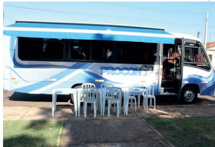
ITINERANTE - Procon Móvel fica estacionado em frente ao ponto de ônibus da escola CAIC Trajano Maciel Filho, na região do Jardim Bocayuva

Na terça-feira (12), das 9h às 16h, o Procon Móvel fica estacionado em frente ao ponto de ônibus da escola CAIC Trajano Maciel Filho para atender a população que passar pela região do Jardim Bocayuva. Além de orientações diversas sobre os direitos do consumidor, a unidade também conta com a participação do projeto Cidadania Itinerante, com serviços da Se-