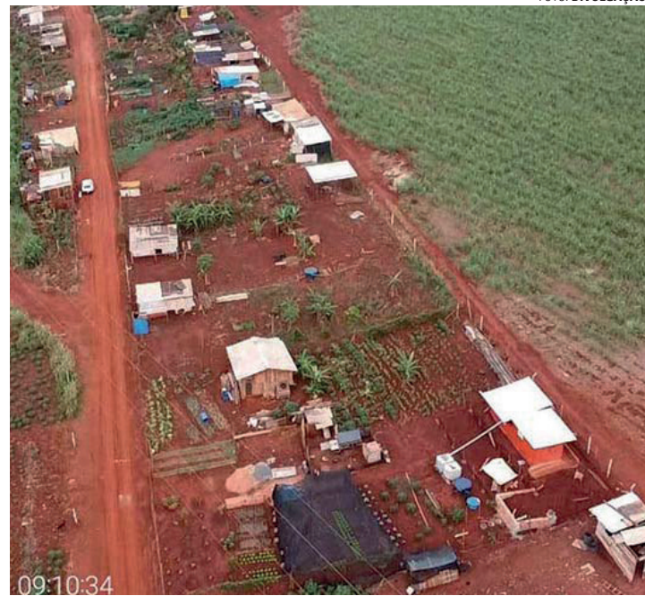
IRREGULAR - Acampamento ilegal se espalhou além das terras da União e invadiu terras particulares na região da Fazenda São Domingos

Grupo tem duas semanas para deixar propriedade particular amigavelmente;