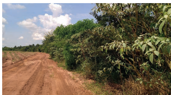
LENÇÓIS - Em parceria com o Governo do Estado, PHD-Cana e a Ascana recuperaram mais de 10 hectares de mata ciliar no Córrego das Posses

são totalmente sustentáveis, ou seja, mantêm o equilíbrio entre o desenvolvimento econômico e a preservação ambiental. Isso é feito graças à implementação de medidas como a manutenção de matas ciliares e APP's (Áreas de Preservação Permanente), recu-