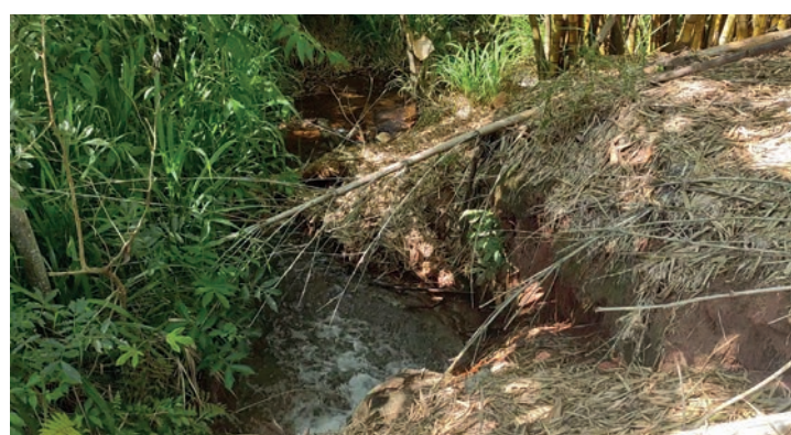
PEDERNEIRAS - Mata ciliar do Córrego da Paciência ganhou 300 árvores nativas em 2017, com acompanhamento de profissionais da Agrícola Stabile