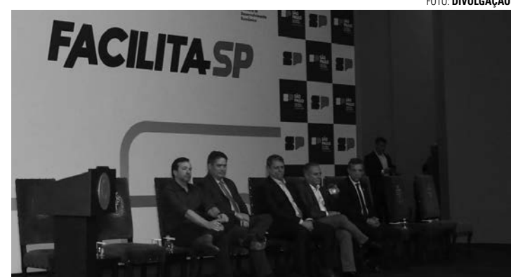
BENEFÍCIOS - Programa do Governo do Estado deve promover a liberdade econômica e a desburocratização nos municípios paulistas

O secretário de Finanças acrescenta que, após a adesão ao programa, o governo irá iniciar um treinamento tecnológico com os municípios participantes, inclusive Lençóis Paulista. O objeti-