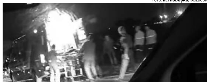
ESTADO GRAVE - Indivíduo foi socorrido com ferimentos graves à UPA

De acordo com o Sargento Everton Cardoso, da base local do Corpo de Bombeiros, que atendeu a ocorrência, o motorista do