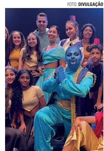
LÚDICO - Espetáculo de dança é baseado no famoso filme 'Aladdin', clássico da Disney

Os ingressos para a apresentação estão à venda a R$ 15 e podem ser adquiridos pelas re-