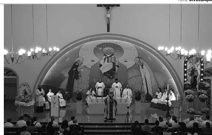
MÊS DE COMEMORAÇÃO - Com missas e diversos eventos recreativos, tradicional festa católica celebra o padroeiro de Macatuba, Santo Antônio

Na próxima sexta-feira (14), tem Show de Prêmios no Salão Paroquial a partir das 19h, com diversos brindes para a população no geral. Quem quiser participar pode comprar uma cartela, comercializada a R$ 15, antecipadamente no Salão Paroquial ou na hora do evento. O prêmio má-