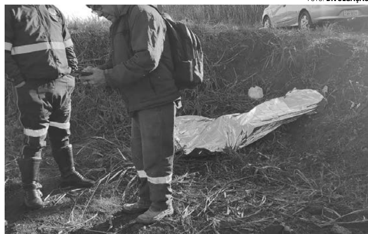
ÓBITO - Corpo de Bombeiros e SAMU constatarem o óbito no local

Segundo a PM, uma viatura se deslocou até o local ao saber sobre o acidente. O Corpo de Bombeiros e o SAMU (Serviço de Atendimento Móvel de Ur-