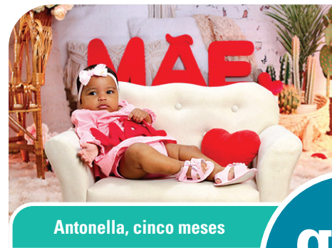
Antonella, cinco meses