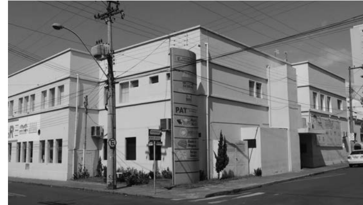
OPORTUNIDADE - Palestra gratuita acontece na sede da Secretaria de Desenvolvimento Econômico de Lençóis Paulista, das 19h às 21h do dia 18

A palestra 'Administração: realidades, cenários e tendências da profissão' acontece no próximo dia 18, terça-feira, das 19h às 21h, na sede da Secretaria de Desenvolvimento Econômico de Lençóis Paulista. (Rua Cel. Joaquim Gabriel, 11, Centro). Os interessados podem