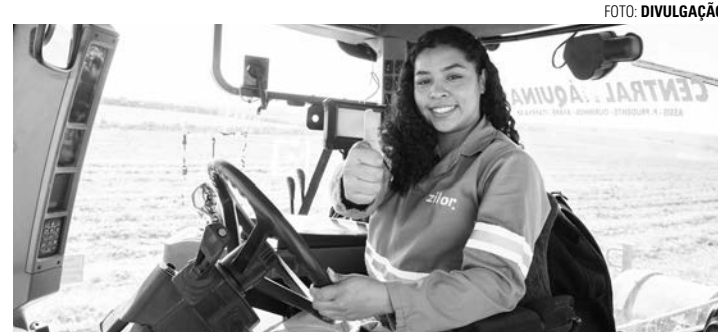
FORMAÇÃO - Curso já foi ministrado em Lençóis Paulista, Macatuba e Quatá, formando e qualificando cerca de 120 mulheres das cidades

O curso terá duas turmas de 15 pessoas cada. A primeira deve ter suas vagas preenchidas, exclusivamente, por mulheres; já a segunda tem prioridade para o público feminino, mas, caso não