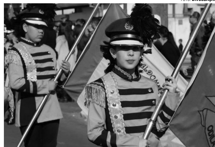
FESTA NA AVENIDA - Expectativa da organização é de que mais de 5 mil pessoas acompanhem o desfile cívico de aniversário de Macatuba

"Nossa expectativa é das melhores, já que teremos uma quantidade considerável de pessoas participando e também a previsão de um clima agradável para a hora do desfile. Acompanhei de perto o trabalho da comissão organizadora, e posso garantir que muitas surpresas estão programadas. Quero parabenizar a todos pelo trabalho e convidar a população macatubense para estar presente em nosso desfile, um momento tão tradicional e impor-