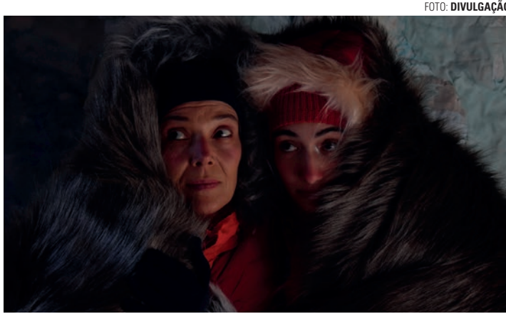
AVENTURA - Peça conta história de cientista que vivencia experiência única ao ser convidada para observar derretimento das geleiras do Ártico

Inserida na programação do Circuito de Artes, promovido pela ALIC (Associação Lençoense de Incentivo à Cultura) com patrocínio da empresa Bracell e apoio da Secretaria de Cultura de Lençóis Paulista, a peça viabilizada com recursos do ProAC (Programa de Ação Cultural), do Governo do Estado de São