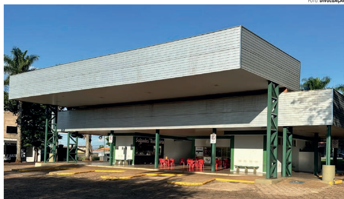
PERMANENTE - Feira do Produtor vai acontecer todo domingo, das 6h às 13h, no Terminal Rodoviário de Macatuba