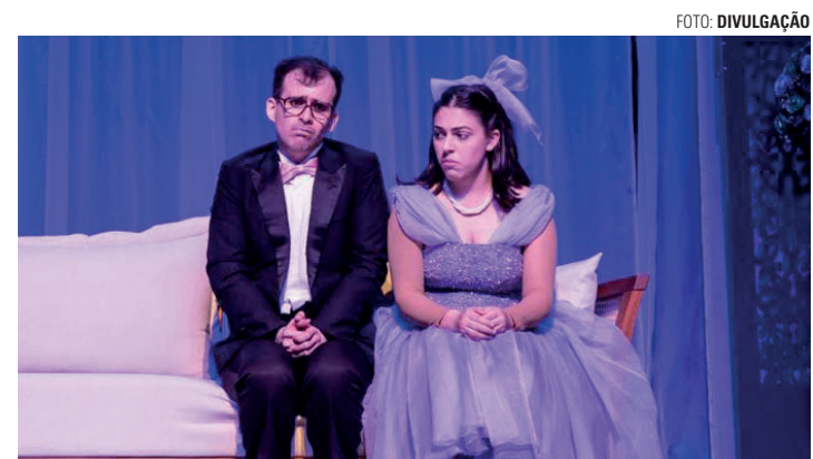
NO PALCO - Montagem é uma adaptação de uma das principais obras do escritor Pedro Bloch; no sábado, apresentação acontece a partir das 17h

Escrito na década de 1950, o texto narra a história da personagem que dá nome à peça, uma jovem recém-saída de um