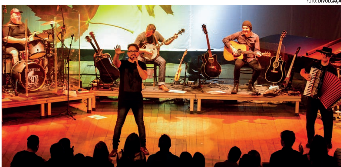
NO PALCO - Principal atração é banda gaúcha Nenhum de Nós, que encerra o 5º Motorock no dia 14 de julho

Ainda na parte musical, o Motorock reserva uma extensa programação de apresentações com bandas de Lençóis Paulista. Um chamamento público lançado pela Secretaria de Cultura vai