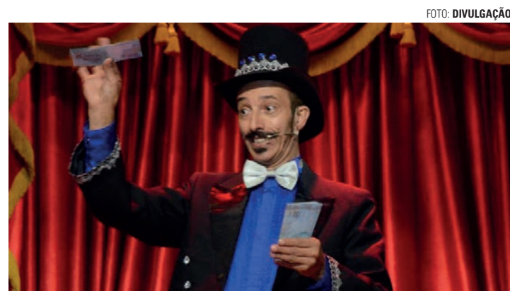
PARA TODAS AS IDADES - Atração com classificação livre transmite mensagem de que todos devem acreditar em si e correr atrás dos sonhos

Além disso, a proposta do espetáculo é transmitir a mensagem de que todos devem acreditar em si mesmos e correr