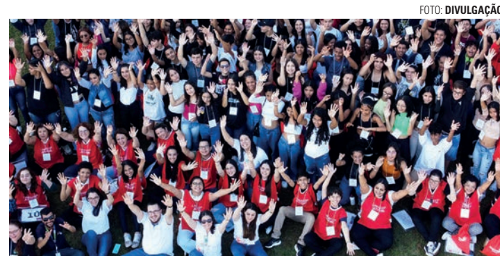
PROTAGONISMO - Jovens interessados em participar do evento devem se inscrever até neste domingo (16) de maneira on-line pelo site do projeto

Evento para jovens de 13 a 18 anos acontece pelo segundo ano consecutivo em Macatuba