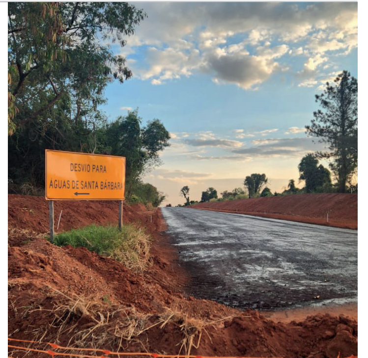
AVANÇANDO - Aplicação da manta asfáltica já teve início nesta semana a partir do trecho próximo à Vicinal José Adalto Vasconcelos (LEP-454)

A segunda fase, sob jurisdição da regional de Assis do DER, ainda não saiu do papel por conta de atrasos na elaboração do projeto executivo que detalha a parte técnica, inclusive para solicitação das licenças. Com 28,7 quilômetros de extensão (entre os quilômetros 58,00 e 78,77) entre Iaras e Águas de Santa Bárbara, o trecho deve requerer investimento maior, mas as projeções atuais não foram divulgadas. ■