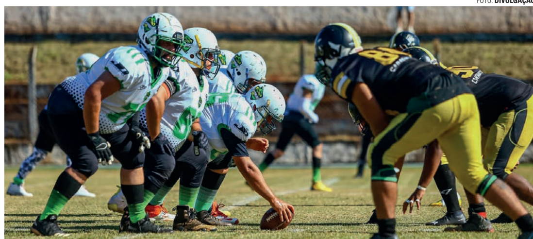
TUDO OU NADA - Guarás reencontra Werewolves em partida que vale o título da temporada 2024 da SPFL

“Após uma excelente semifinal contra um adversário muito forte, iremos reencontrar o Werewolves, outra ótima equipe que está evoluindo no futebol americano. Esperamos um con-