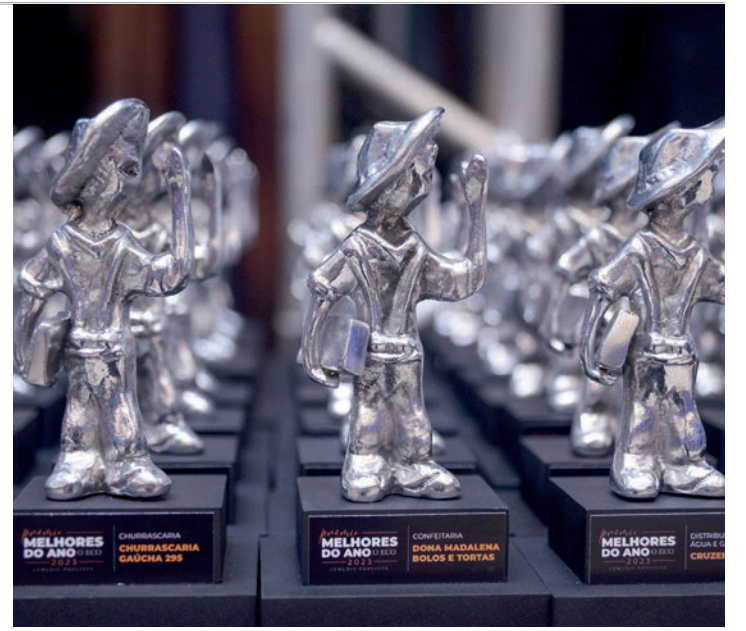
SÓ TEM UM - Pesquisas que elegem os Melhores do Ano de Lençóis Paulista e Macatuba acontecem apenas pelos canais oficiais de O ECO

“Sempre nos deparamos com situações do tipo. Já acionamos