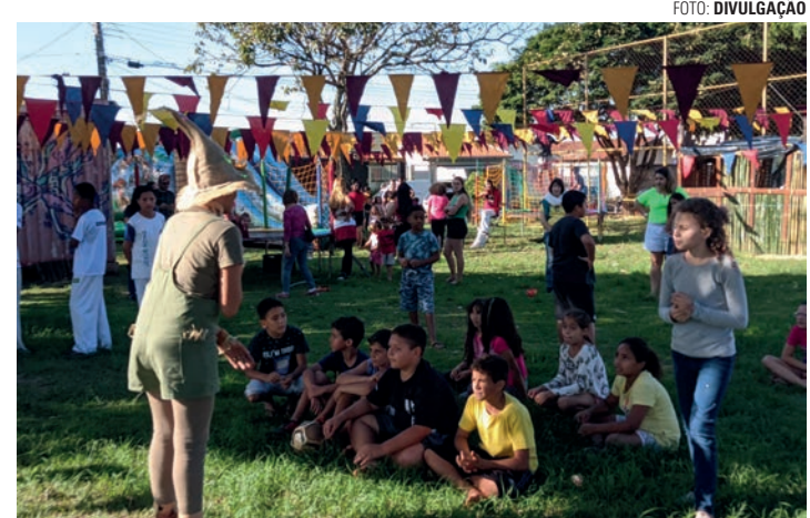
TRADIÇÃO - Na foto, festa junina realizada em 2023 no Jardim do Caju