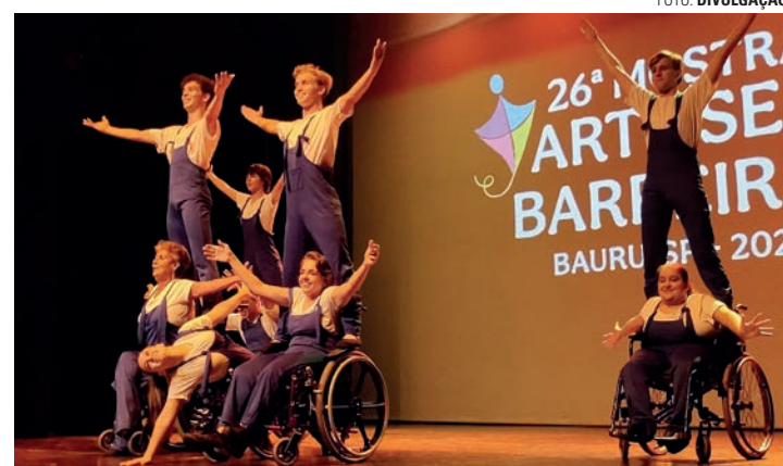
RODAS QUE DANÇAM - Curso adaptado de dança com acessibilidade para cadeirantes é uma das opções disponíveis para o segundo semestre

Os interessados devem acessar o link https://linktr.ee/culturalencois e preencher o formulário. No caso dos menores de idade, o processo