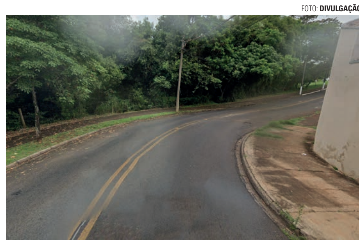
CURVA - Ao fazer uma curva, ônibus acabou se chocando contra um carro que vinha na direção oposta; felizmente, ninguém se feriu com o acidente

Condutoras compareceram até o batalhão da Polícia Militar para registrar a ocorrência