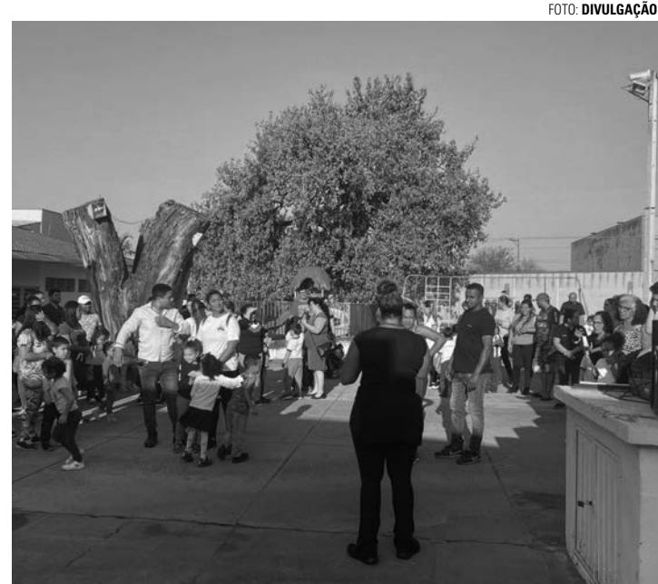
CRIANDO MOMENTOS - Na foto, comemoração do 'Dia da Família' no Lar da Criança, que também buscava criar boas lembranças familiares

Com café da manhã e brincadeiras ação tem o objetivo de fortalecer os laços familiares