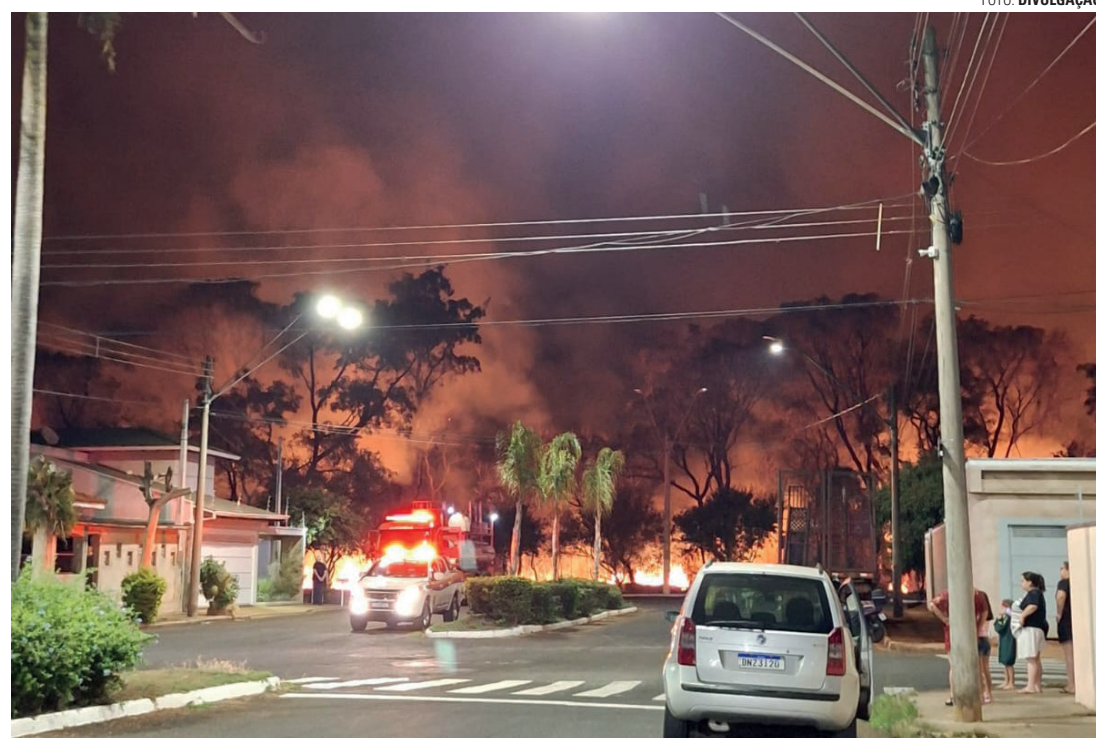
QUEIMADA - Área de mata de cerca de 15 hectares foi consumida pelo fogo na noite da última quarta-feira (7)

De acordo com o cabo Diniz, da base local do Corpo de Bombeiros, a equipe só foi acionada cerca de uma hora após o início do incêndio, o