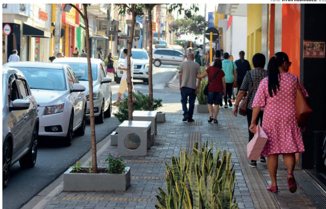
MOVIMENTAÇÃO - Lojas de Lençóis Paulista esperam aumento de procura de presentes neste sábado (10)

"Acreditamos que o número de pessoas na loja tende a aumentar até sábado, porque tivemos bastante movimentação nos dias que antecederam a data no ano passado. A expectativa de venda é boa, pois temos muitas opções para oferecer, como tênis e camisetas, que saem bastante nessa época. Além disso, o his-