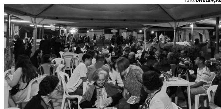
TRADIÇÃO - Quermesse do Asilo conta com uma estrutura que oferece diversas barracas com opções de comidas, bebidas e até brincadeiras

A quermesse conta com várias barracas de quibe, pastel, lanche de pernil, espeto empanado, crepe, doces, bebidas diversas (cervejas, refrigerantes e sucos) e brincadeiras. O local conta com uma estrutura com mesas e cadeiras para que o público possa consumir con-