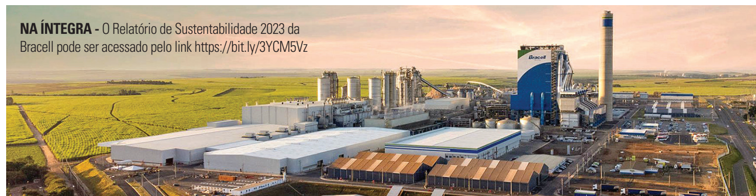
NA ÍNTEGRA - O Relatório de Sustentabilidade 2023 da Bracell pode ser acessado pelo link https://bit.ly/3YCM5Vz

Destaque é ampliação dos projetos de proteção de florestas e de apoio à comunidade