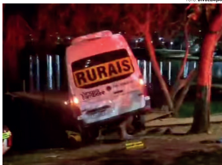
SUSTO - Veículo só não caiu na água porque ficou preso ao atingir equipamentos de academia ao ar livre e uma grade no Parque do Povo