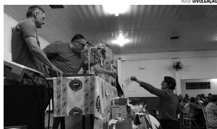
TRADIÇÃO - Show de Prêmios já é tradição e é organizado pela entidade há anos; na foto, entrega de brindes em evento realizado em 2023

Com as adesões à venda a R$ 15, a ação beneficente da APAE de Macatuba conta com prêmio principal R$ 1 mil e, de acordo