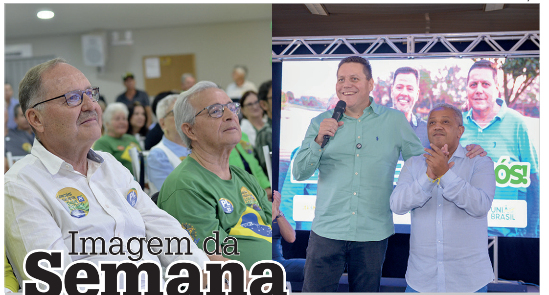
Imagem da Semana

Foi uma noite de sucesso total abrihantada por uma animada apresentação da banda ABR3, que empolgou o público com um repertório bem eclético. Mais um projeto concluído com êxito com o apoio fundamental de dezenas de pessoas, principalmente das empresas que acreditaram em tudo o que o Melhores do Ano representa. Nosso muito obrigado a todos os que fazem parte dessa história!