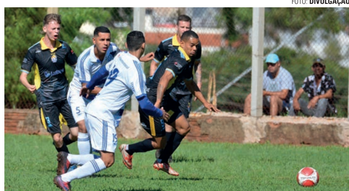
MATA-MATA - Equipes entram em campo na briga por vagas na semifinal

Chegou a hora do mata-mata na Copa Regional de Futebol Amador de Lençóis Paulista. Com a classificação da primeira fase definida no último domingo (24), as oito melhores equipes da competição promovida pela Secretaria de Esportes e Recreação