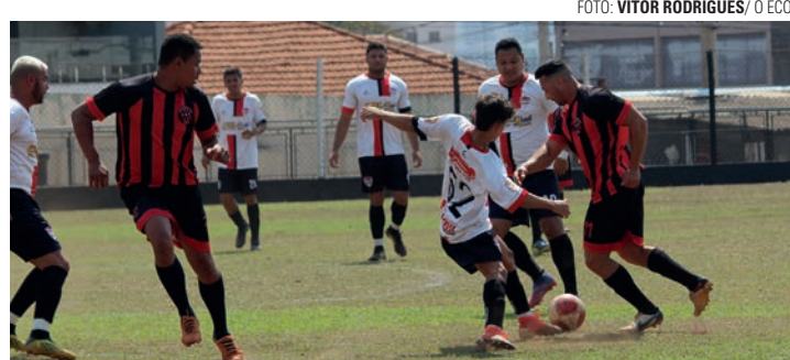
TUDO OU NADA - Copa Lençóis conhece semifinalistas neste domingo (1)

A Copa Lençóis de Futebol Amador também tem momentos decisivos neste domingo (1), com os quatro confrontos válidos pelas quartas