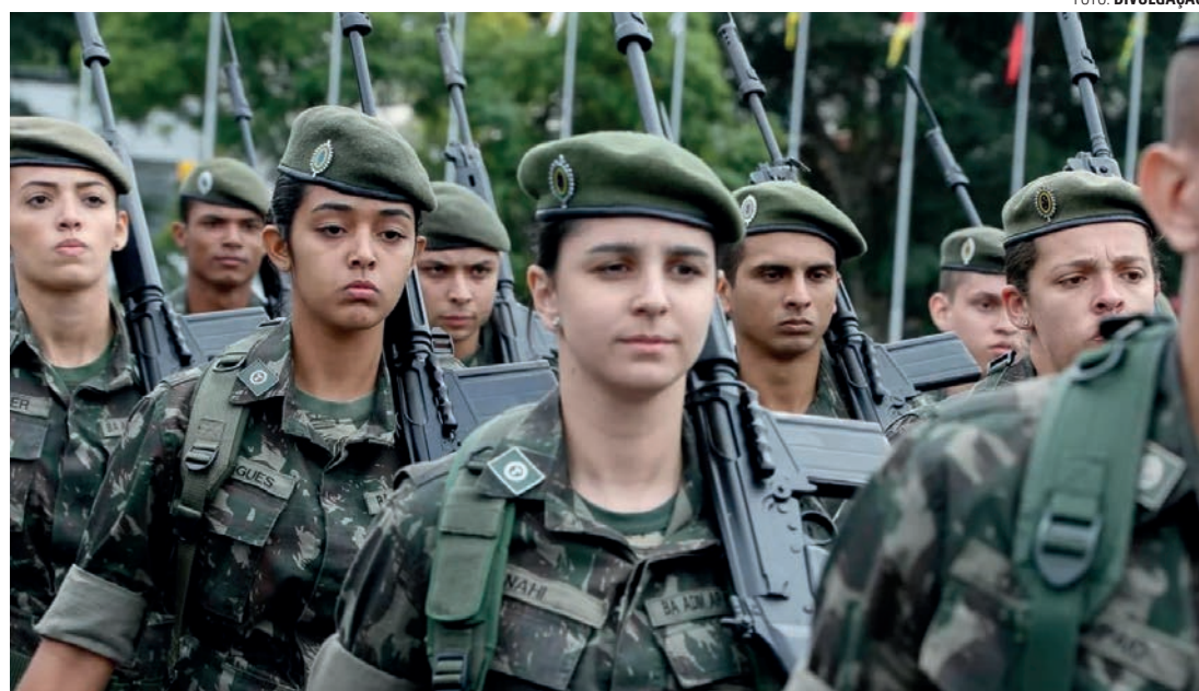
ABERTURA - Antes da medida, mulheres podiam ingressar nas Forças Armadas apenas como militares de carreira

A partir de 2025, mulheres que completam 18 anos podem se alistar nas Forças Armadas para prestar o Serviço Militar Inicial Feminino na Marinha, Exército ou Aeronáutica. A medida é exclusiva para quem reside nos municípios listados no Plano Geral de Convocação - em São Paulo, apenas na capital, Pirassununga e Guaratinguetá. Diferente do masculino, a inscrição é voluntária.