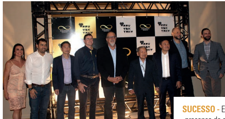
SUCESSO - Evento contou com a presença de clientes e parceiros que usufruíram de um delicioso jantar no Infinity Residence

Com 15 andares, o prédio conta com 120 apartamentos com 153 m² de área total e 82 m² de área privativa, com três dormitórios, incluindo uma suíte, salas de estar e jantar integradas, cozinha, área de serviço, sacada