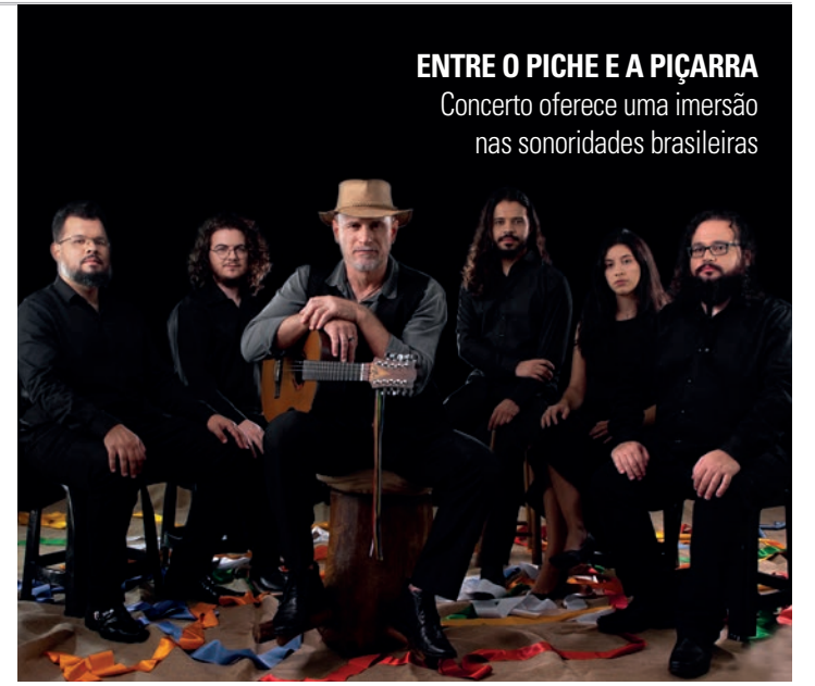
ENTRE O PICHE E A PIÇARRA Concerto oferece uma imersão nas sonoridades brasileiras

O espetáculo integra a programação de dezembro da ALIC (Associação Lençoense de Incentivo à Cultura), que conta com apoio da Secretaria de Cultura do município e patrocínio das empresas Ferragens São Carlos, Grunner, Lwart Soluções Ambientais e Zilor Energia e Alimentos, por meio da Lei de Incentivo à Cultura (Lei Rou-