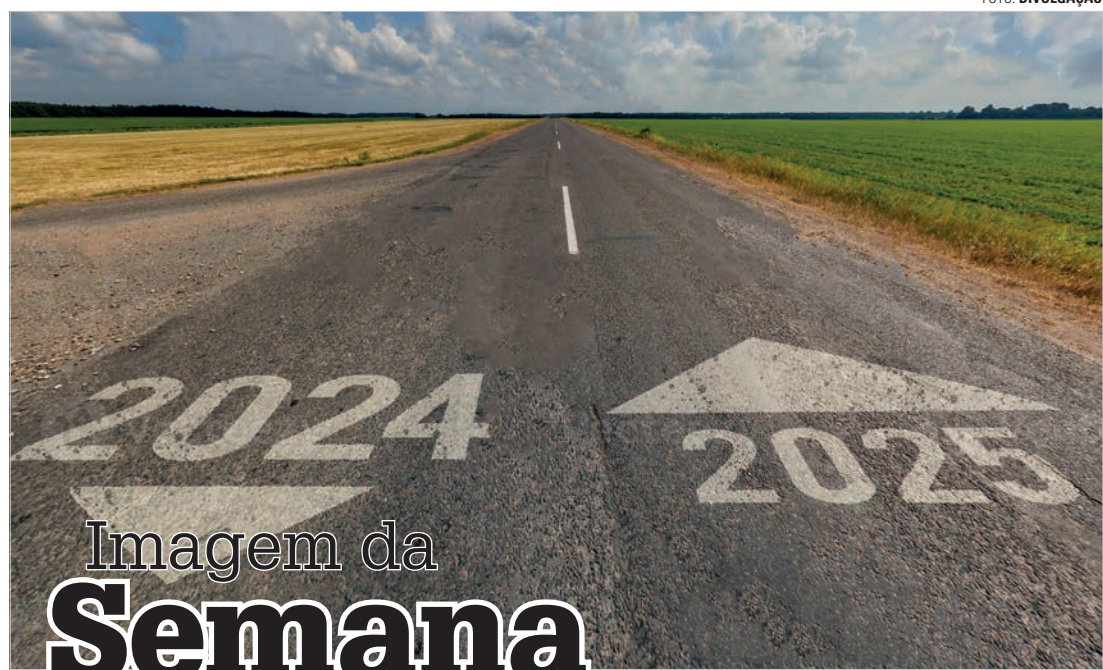
Imagem da Semana

Uma sociedade pluralista propicia maior distribuição de poder, maior distribuição de poder abre caminhos para a democratização social e, por conseguinte, a democratização da sociedade civil adensa e amplifica a democracia política, de acordo com o pensamento de Norberto Bobbio. No Brasil, estamos caminhando firmes nessa direção e a prova mais eloquente da tendência se verifica na formidável malha de centros de poder instituídos em todos os âmbitos. Aproximase de um milhão o número de entidades não-governamentais, mostrando que a organicidade social é o mais impactante vetor de mudanças de nossos tempos. E mais: o Brasil começa a fechar o ciclo da política de oportunidades.