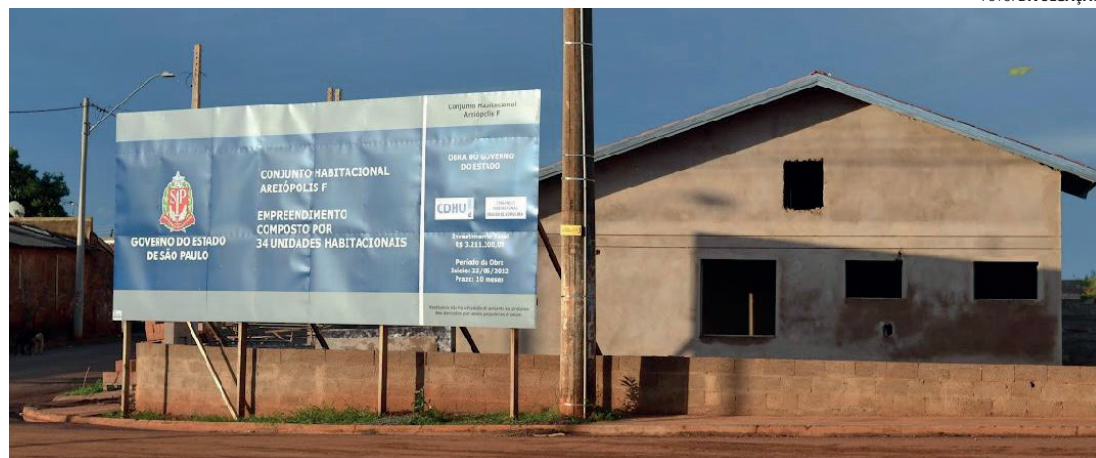
MORADIA POPULAR - Areiópolis irá construir mais 25 residências do programa Minha Casa, Minha Vida

Areiópolis vai construir mais 25 moradias pelo programa Minha Casa, Minha Vida a partir do próximo ano. De acordo com informações da Prefeitura Municipal, os trâmites para a viabilização estão em andamento e os imóveis são destinados a pessoas enquadradas na faixa 1 do programa habitacional mantido pelo Governo Federal, destina-