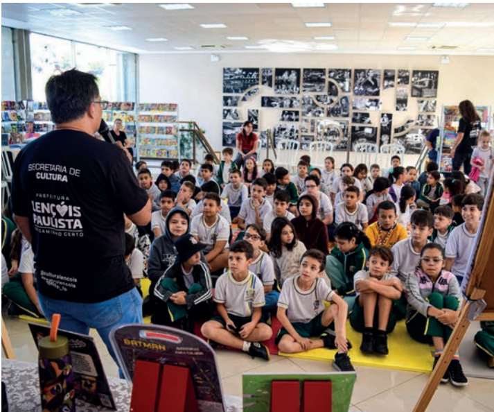
PRESENÇA ATIVA - Com programação diversificada, festival literário recebeu alunos de diversas escolas das redes pública e privada de Lençóis Paulista

Encerrado no último domingo (23), festival promoveu várias atrações em oito dias de programação