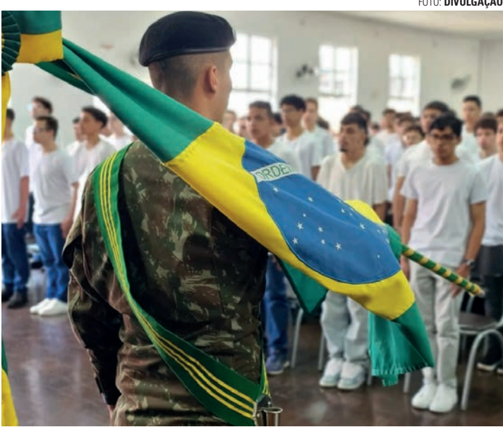
PRAZO - Alistamento deve ser feito até o dia 30 de junho em todo o país

Quem é do sexo masculino e completou ou vai completar 18 anos em 2026 deve fazer o alistamento militar obrigatório em todo o Brasil. O prazo começou no último dia 1 e se encerra no dia 30 de junho. Quem tiver pendências com o Serviço Militar após o período, além de estar sujeito a uma multa pelo descumprimento da legislação, pode sofrer uma série de sanções de ordem administrativa. O alistamento pode ser feito pelo site https://alistamento.eb.mil.br , utilizando uma conta Gov.Br; pelo aplicativo do Exército Brasileiro (compatível com sistemas Android e iOS), disponível para download gratuito nas Play Store e App Store; ou nas Juntas de Serviço Militar de cada município (confira os endereços ao final). Em todos os casos, é necessário ter em mãos documentos como CPF e RG. É importante destacar que o alistamento on-line (site ou