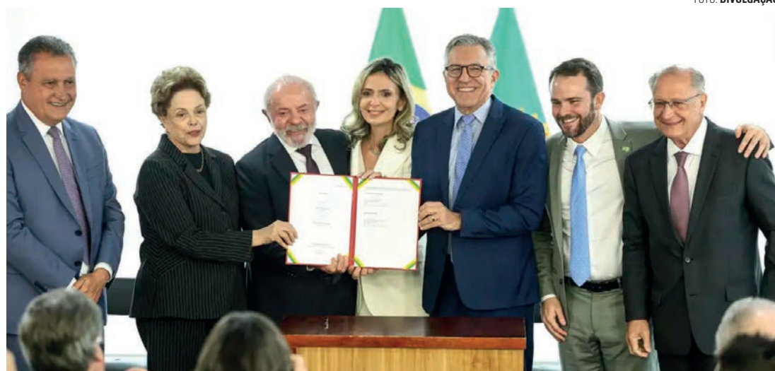
PARCERIA - Convênio de R$ 1,7 bilhão com o banco do BRICS representa a maior parte do investimento no projeto

Planejado para ser referência nacional e internacional, com modelo de assistência em saúde totalmente digital, o ITMI usará inteligência artificial (IA), telemedicina e conectividade integrada. Sediada em São Paulo, capital, a nova unidade fará parte da Rede Nacional Agora Tem Especialistas de Hospitais e Serviços Inteligentes, que tem previsão inicial de investimento