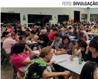
PRIMEIRO DO ANO - Evento acontece no dia 13 de fevereiro

O Lar Nossa Senhora dos Desamparados, o Asilo de Lençóis Paulista, marcou para fevereiro o primeiro evento beneficente de 2026. O tradicional show de prêmios, realizado em parceria com o Lions Clube do município, acontece no dia 13 do próximo mês, a partir das 19h30, na sede do clube de serviços, que fica na Av. Padre Salústio Rodrigues Machado, 895, no Jardim Ubirama. As adesões estão à venda a R$ 20 e podem ser adquiridas antecipadamente na recepção do Asilo, com acesso pela Rua Cel. Álvaro Martins, 539, na Vila Nova Irerê. Os interessados também podem entrar em contato com voluntários da entidade ou membros do Lions Clube. De acordo com a organização, as cartelas também devem ser comercializadas no evento. Além dos prêmios principais de R$ 4 mil e R$ 500 em dinheiro, respectivamente para o bingão e quinas, os participantes concorrem a diversos prêmios nas cartelas extras e sorteios realizados durante o evento. Para esclarecer dúvidas ou obter outras informa-