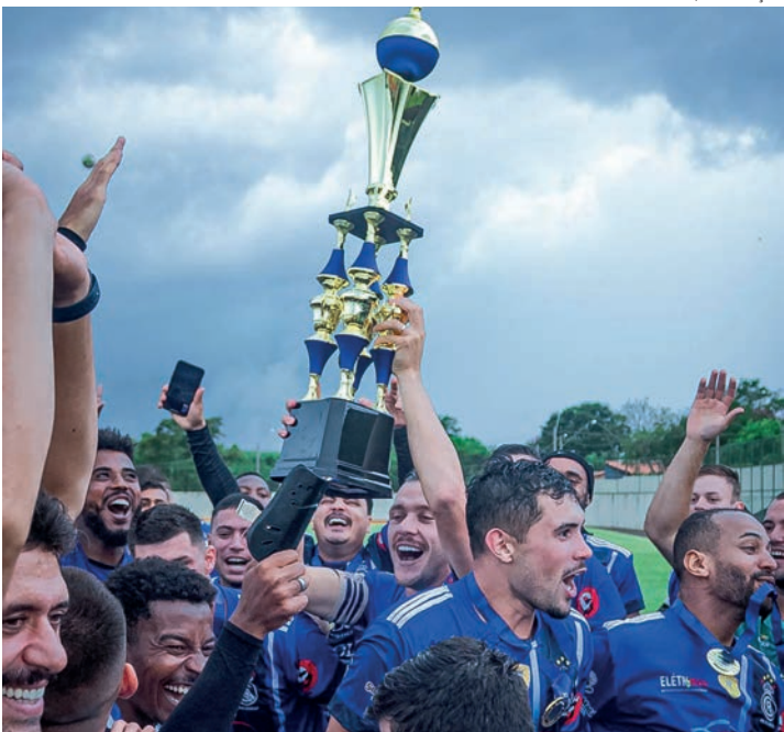
DONO DA TAÇA - Real Cedega, de Igarapu do Tietê, é o atual bicampeão

Borebi se prepara para a realização de sua 8ª Copa Regional de Futebol Amador. A partir deste domingo (11), o Estádio Municipal Antônio Vaca recebe equipes de toda a região para a competição que abre o calendário esportivo da área de cobertura de O ECO. O torneio conta com 16 times de 11 cidades: Borebi, Agudos, Avaré, Barra Bonita, Bauru, Iacanga, Igarapu do Tietê, Lençóis Paulista, Macatuba, Pederneiras e Trabiju. O Grupo A conta com Real Cedega (Igarapu do Tietê), Trabiju, Online (Bauru) e Zona Norte (Agudos). O Grupo B é formado por Agrícola Martins (Avaré), Flamengo (Agudos), Grêmio Cecap (Lençóis Paulista) e Borebi B. O Grupo C tem Borebi A, Fúria (Barra Bonita), Unidos do JF (Lençóis Paulista) e Baile (Bauru). O Grupo D é composto por Nacional (Bauru), Mullek's (Pederneiras), XX de Janeiro (Macatuba) e Iacanga. De acordo com o regulamento da competição, os 16 times ins-