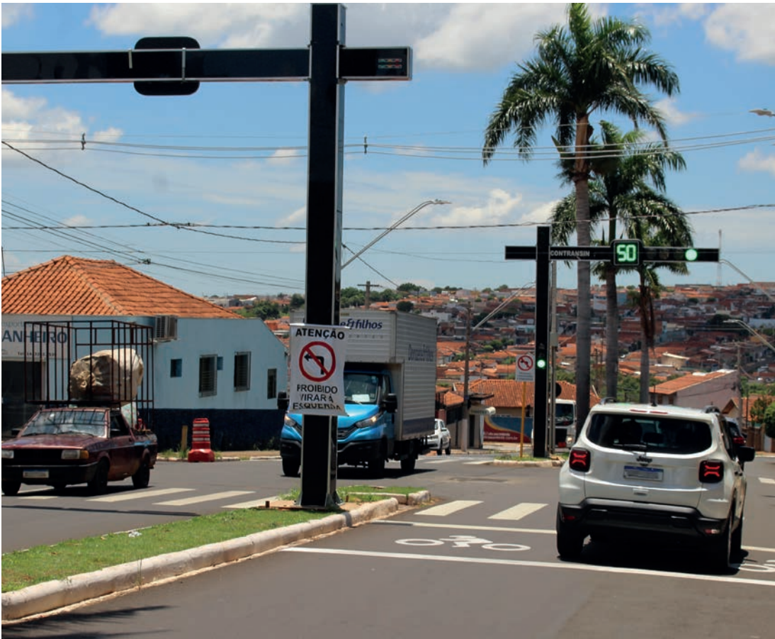
FUNCIONANDO - Implantação de semáforo no cruzamento com a Rua Piedade foi uma das principais alterações

Desde a última segunda-feira (5), estão vigentes algumas mudanças no trânsito de Lençóis Paulista, especialmente na Avenida Padre Salústio Rodrigues Machado. Além da implantação de um novo semáforo no cruzamento com a Rua Piedade, a via teve os demais dispositivos sincronizados com o objetivo de otimizar o fluxo de veículos. Com a sincronização, os semáforos da avenida passaram a funcionar em frequência coordenada, garantindo que, em determinados momentos, todos apresentem a mesma indicação luminosa (verde, amarela ou vermelha). O sistema permite que os motoristas avancem de forma contínua, melhorando significativamente o fluxo. Para a sincronização, alguns semáforos tiveram seus tempos alterados com a redução de quatro para três estágios, a abertura simultânea nos dois sentidos da avenida e a proibição de conversão à esquerda na maioria dos cruzamentos. O novo semáforo tem dois estágios, com a abertura nos dois sentidos da avenida e depois na Rua Piedade. A sinalização foi reforçada em todos os pontos de alteração, mas a orientação é para que to-