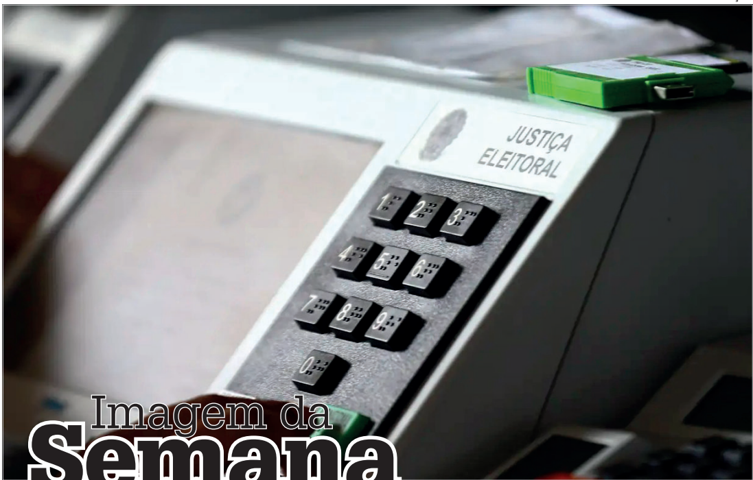
Imagem da Semana

ANO ELEITORAL - Mais de 155 milhões de brasileiros têm um encontro marcado com as urnas neste ano. Em 4 de outubro, eleitores de todo o país escolhem deputados federais e estaduais, senadores, governadores e presidente. Em um ano de extrema importância para a democracia, a Justiça Eleitoral adotou a hashtag #votonademocracia como slogan das eleições, que também celebram os 30 anos da urna eletrônica.