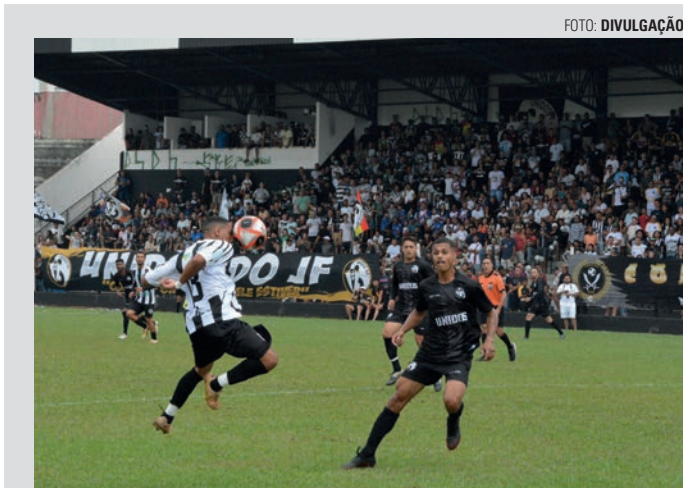
BREGÃO - A semana foi marcada por uma ótima notícia para os lençoenses apaixonados por futebol. Na última quarta-feira (21), durante um encontro realizado no plenário da Câmara Municipal, foram anunciados R$ 400 mil para o projeto de implantação de iluminação no Estádio Municipal Archangelo Brega (Bregão). Os recursos são oriundos de uma emenda parlamentar do deputado federal Maurício Neves (PP), destinada ao município por intermédio do vereador Antônio Vieira de Moraes (PP).

De acordo com o regulamento do torneio, os 16 times inscritos estão divididos em quatro grupos na primeira fase, nos quais todos jogam contra todos em turno único. Cada rodada coloca em campo equipes de duas chaves, com duas partidas de manhã e duas no período da tarde, todas no Estádio Municipal Antônio Vaca. Apenas os dois melhores de cada grupo avançam para os confrontos mata-mata (quartas de final). ■