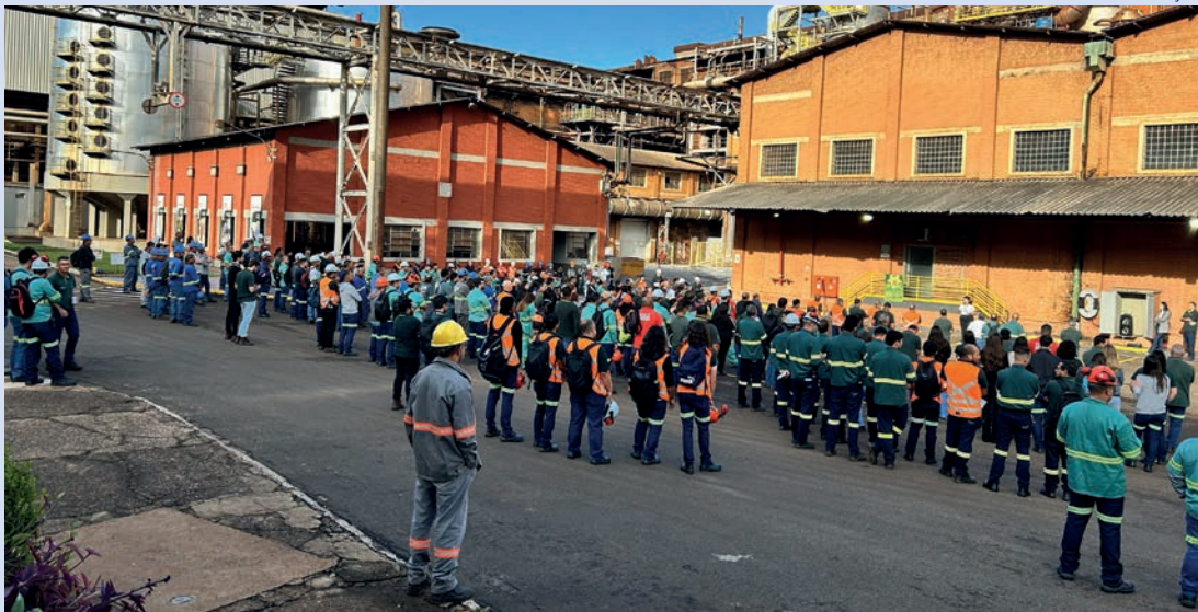
BEM-ESTAR - Atividades estão envolvendo todas as áreas da companhia e devem mobilizar 4,5 mil colaboradores

Entre as iniciativas previstas estão DDSs (Diálogos Diários de Segurança) com