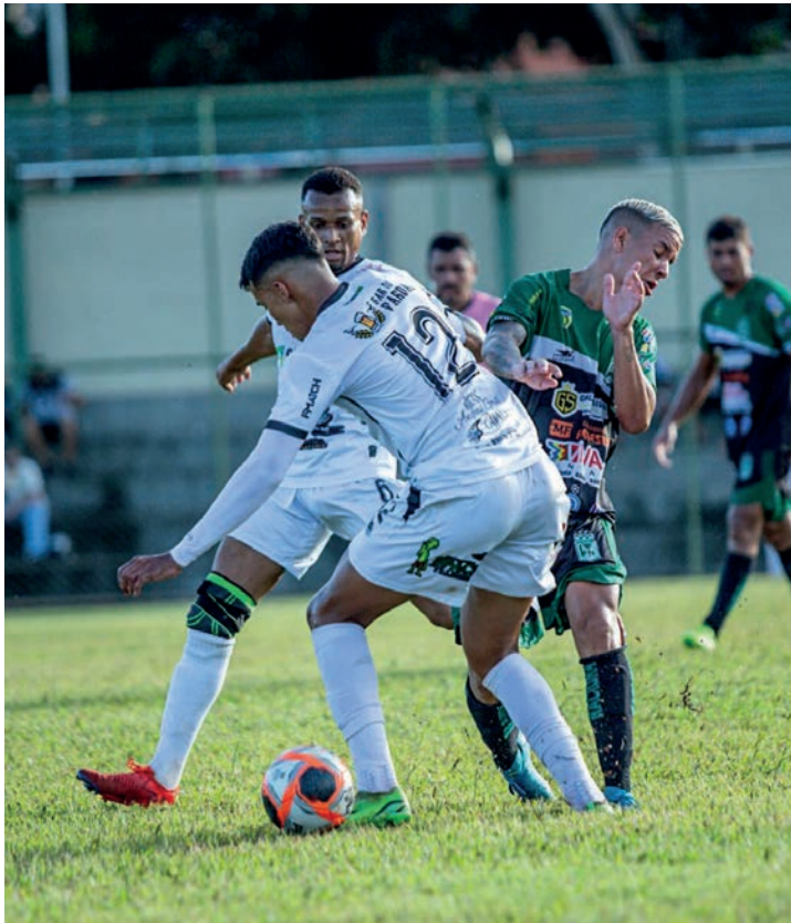
TUDO IGUAL - Nacional e XX de Janeiro (uniforme branco) estrearam com empate sem gols na 9ª Copa Regional de Futebol Amador de Borebi

No período da tarde, foi a vez da estreia dos participan-