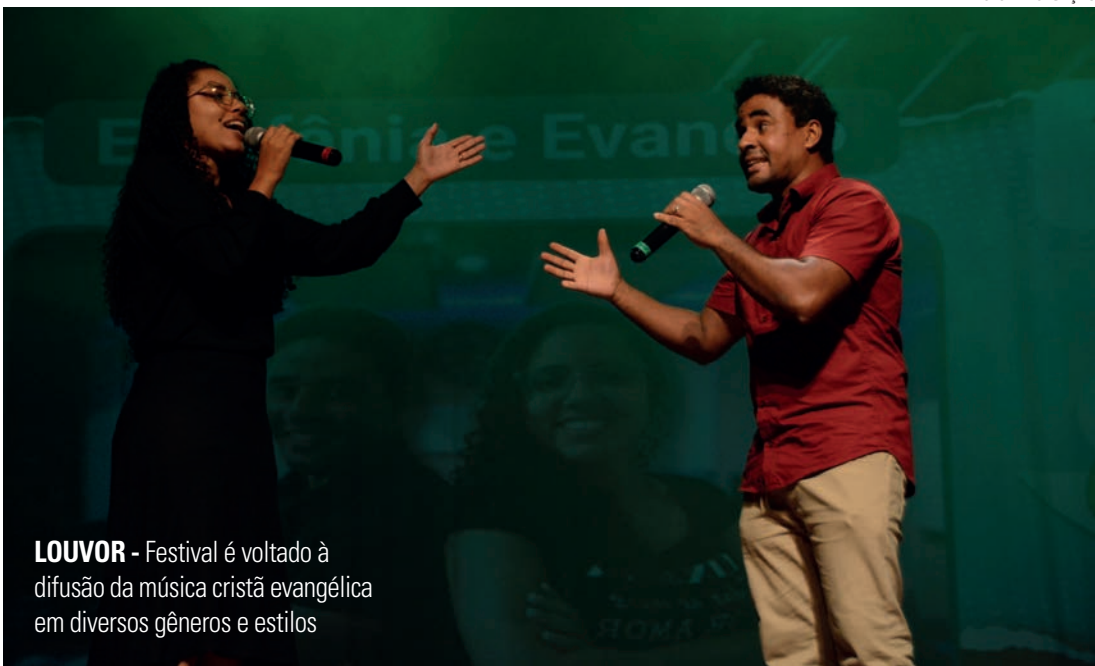
LOUVOR - Festival é voltado à difusão da música cristã evangélica em diversos gêneros e estilos

O festival contempla duas categorias: apresentações com acompanhamento de playback,