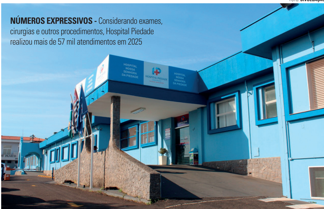
NÚMEROS EXPRESSIVOS - Considerando exames, cirurgias e outros procedimentos, Hospital Piedade realizou mais de 57 mil atendimentos em 2025

Celebrando mais um ano de atividade, o hospital reafirma que tradição e inovação caminham juntas. O ano de 2026 está projetado como um período de consolidação e avanços estruturais e assistenciais. Estão previstas a conclusão das reformas da Maternidade e do Centro Cirúrgico, ampliando a segurança, o conforto e a eficiência, além da continuidade