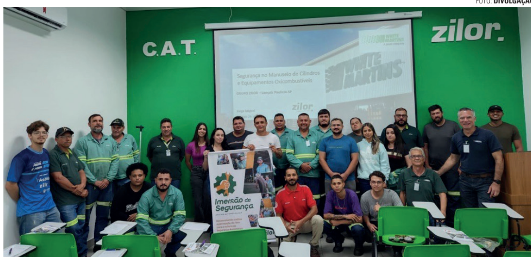
CULTURA DE CUIDADO - Programa amplia o olhar dos colaboradores para práticas mais conscientes no dia a dia

A Zilor Energia e Alimentos está realizando uma imersão de segurança com os colaboradores da área automotiva da Unidade Barra Grande. A iniciativa visa capacitar todos os profissionais da operação até o fim da entressafra. O conteúdo foi estruturado para elevar o nível de conhecimento e engajamento, estimu-