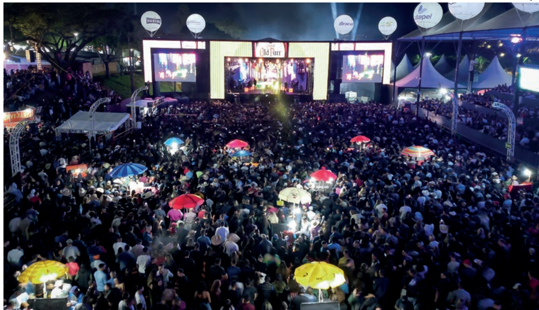
DE PORTAS ABERTAS - Com mudanças, Facilpa deste ano pode ter apenas dois dias com cobrança de ingresso

Das seis participantes, duas apresentaram propostas com maior valor de outorga, mas acabaram inabilitadas. "O processo se estendeu por quase três meses. Foram seguidos todos os trâmites, respeitados os prazos para apre-