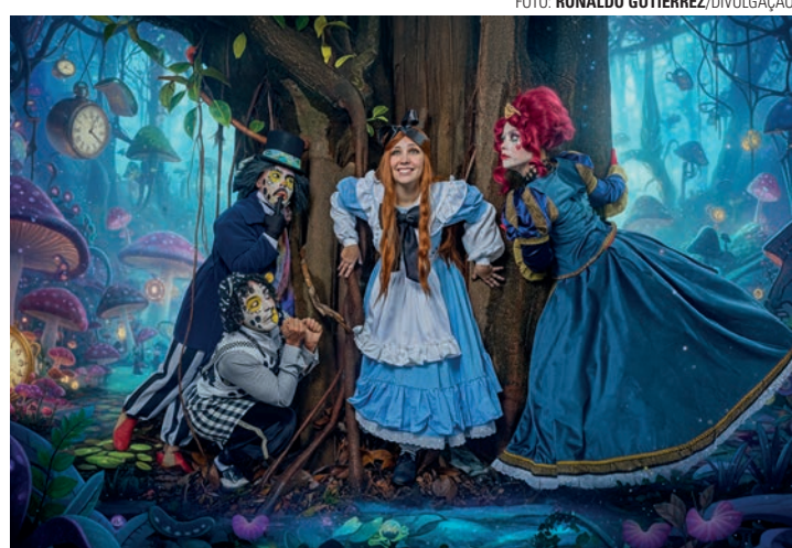
FOTO: RONALDO GUTIERREZ/DIVULGAÇÃO LÚDICO - Peça leva o público a uma viagem pelo mundo da imaginação

Adaptada do clássico do britânico Lewis Carroll (1832-1898), a montagem mostra como a imaginação pode ensinar importantes lições para o crescimento. Além do caráter lúdico e fantástico do enredo, que favorece o encantamento e torna o aprendizado mais envolvente e prazeroso, a peça une tecnologia e arte, inovando