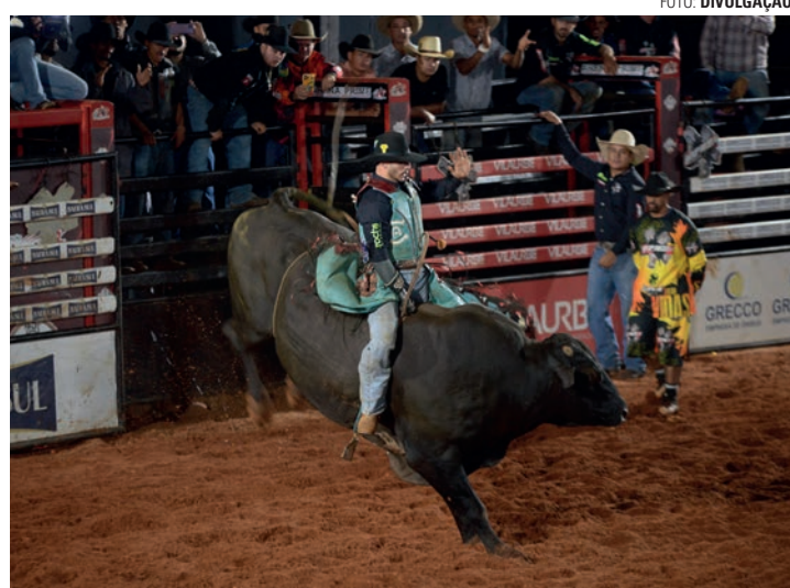
FOTO: DIVULGAÇÃO TRADIÇÃO - Com montarias em touros e cavalos, rodeio promete animar o público da região na arena da 46ª Facilpa; feira começa no dia 24 deste mês

A programação começa com o rodeio em cavalos, no estilo cutiano, que agita o primeiro fim de semana da 46ª Facilpa. Entre os dias 24 e 26 de abril, a tropa Jr. & AS leva animais de alto nível para a arena do recin-