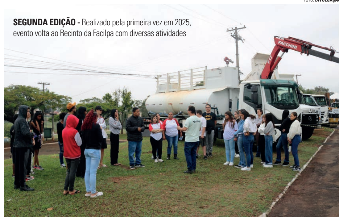
SEGUNDA EDIÇÃO - Realizado pela primeira vez em 2025, evento volta ao Recinto da Facilpa com diversas atividades

Divulgada na tarde dessa sexta-feira (22), a programação do evento conta com diversas atrações gratuitas nos dois dias, das 8h às 17h, no Recinto da Facilpa. Entre as novidades