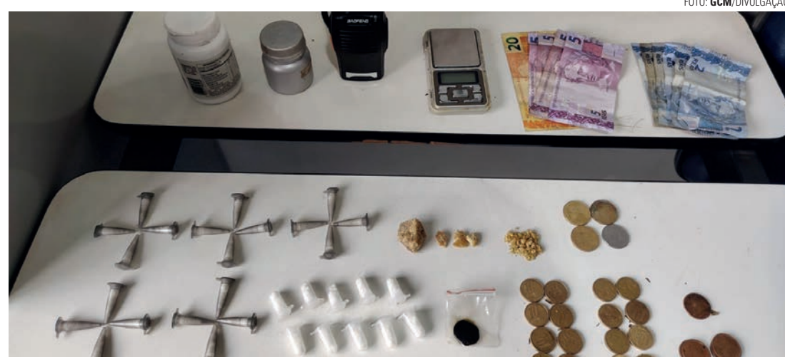
APREENSÃO - Ocorrência resultou na apreensão de drogas, balança de precisão, rádio comunicador e dinheiro

Um homem de 30 anos foi preso por tráfico de drogas na manhã da última segunda-feira (18), em Lençóis Paulista. A ocorrência foi registrada por volta das 10h20, na Avenida Papa João Paulo II, nas proximidades de uma ponte sobre o Córrego da Prata, no Parque Residencial São José. A ação teve início após uma movimen-