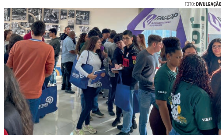
ORIENTAÇÕES - Evento conta com palestras, oficinas, estandes de faculdades e empresas, além de orientações sobre no mercado de trabalho

Escolher uma profissão, buscar o primeiro emprego ou se recolocar no mercado de trabalho exige informação, preparo e contato com novas possibilidades. É este o objetivo da Profituro, que acontece no dia 2 de junho, no Teatro Municipal