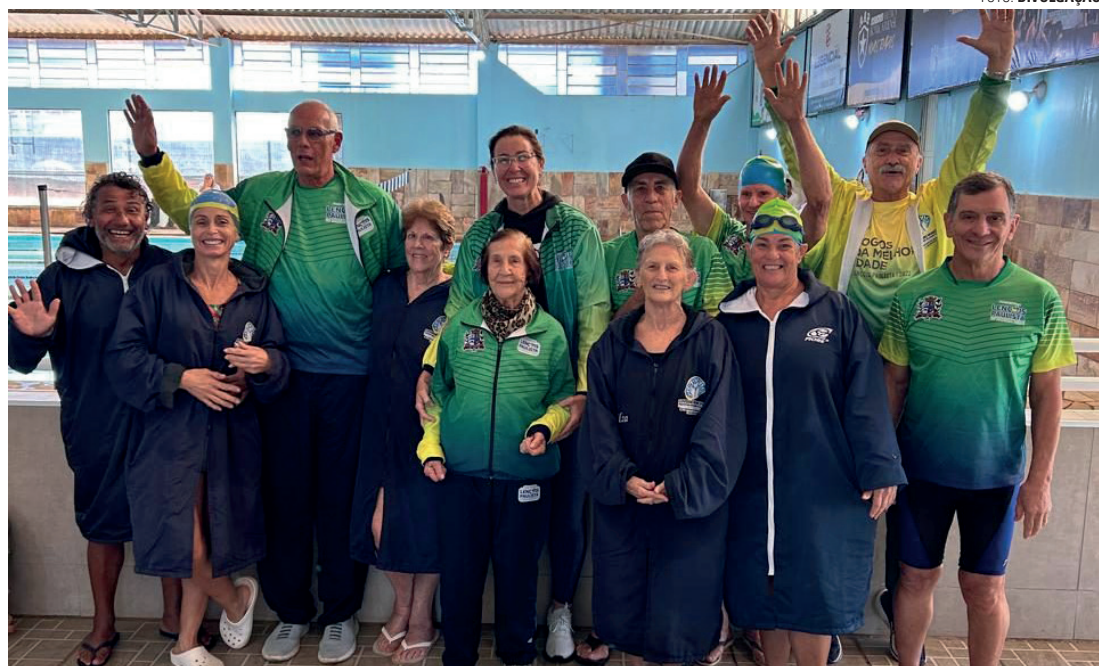
DOBRADINHA - Delegação de Lençóis Paulista garantiu medalhas de ouro na natação feminina e masculina

Em sua 28ª edição, competição está ocorrendo na vizinha São Manuel