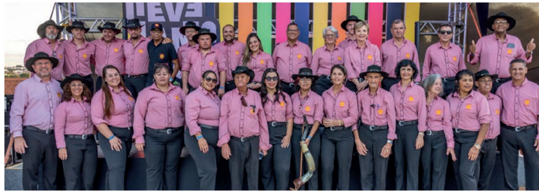
AGENDA - Orquestra se apresenta em importantes eventos nos próximos meses, como a Festa do Peão de Barretos

Criada em julho de 2012, a Boca do Sertão foi regulamentada pela Prefeitura Municipal em 2023, por meio da Lei nº 5.718, passando a ser mantida pela Se-