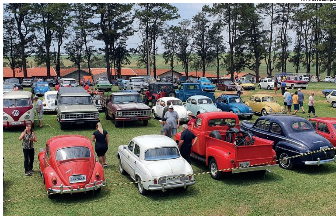
RELÍQUIAS - Público pode conferir os mais variados modelos e marcas de carros antigos em evento em Macatuba

Completando 10 anos de história, o Encontro de Carros Antigos de Macatuba deve reunir colecionadores de toda a região centro-oeste do estado de São Paulo, que chegam à cidade com seus possantes dos mais variados modelos, marcas e anos de fabricação, dos originais aos modificados. Segundo a organização, a estimativa é de que mais de 200 expositores marquem presença no evento.