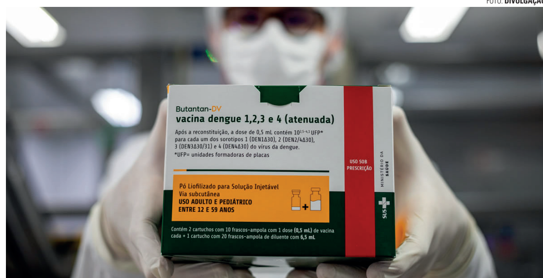
INVESTIGAÇÃO - Segundo a pasta, ainda não há resultado conclusivo sobre a correlação entre os casos e a vacina

A estratégia de vacinação com o imunizante do Butantan estava voltada a profissionais de saúde da Atenção Primária à Saúde e, de forma ampliada, para o público de 15 a 49 anos, de três cidades (Botucatu/SP, Maran-