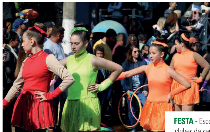
FESTA - Escolas, entidades, clubes de serviço e projetos sociais celebram o aniversário de Macatuba na avenida

Marcado para a manhã do próximo domingo (21), a partir das 9h, o desfile cívico do aniversário de Macatuba promete contagiar o público, especialmente a parcela que, como todo bom brasileiro, é apaixonada por futebol. Aproveitando o clima de Copa do Mundo, o evento pinta a principal via da cidade de ver-