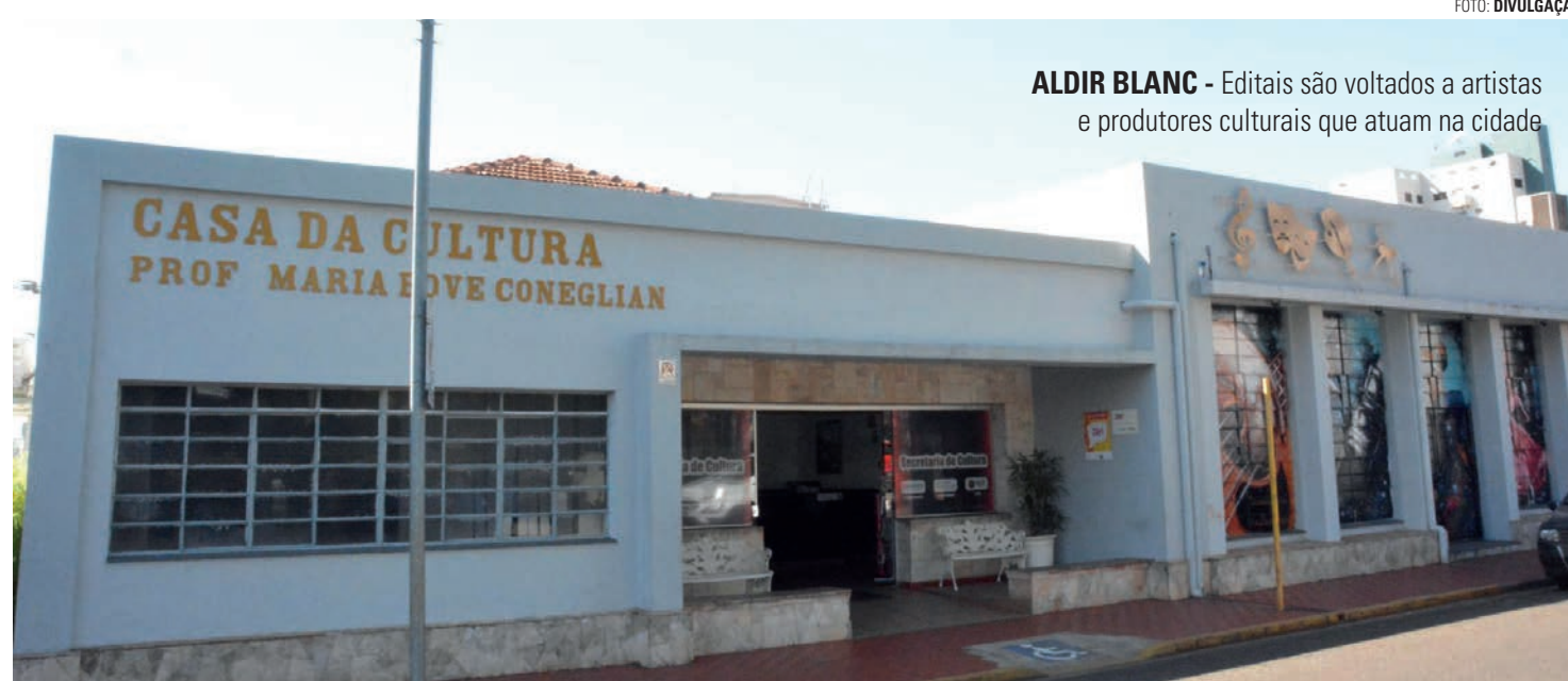
ALDIR BLANC - Editais são voltados a artistas e produtores culturais que atuam na cidade

Os interessados podem consultar os editais completos na plataforma, que também pode ser utilizada para efetuar o download dos anexos referentes aos chamamentos públicos. Quem