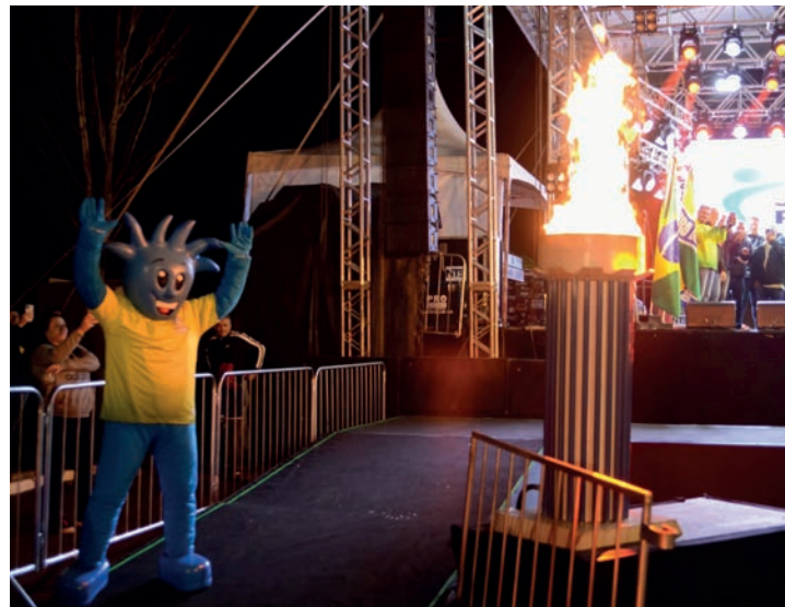
CONTAGEM REGRESSIVA - Jogos Regionais voltam a Lençóis Paulista após três anos; na foto, abertura da edição de 2023, realizada no Recinto da Facilpa

Sediando a competição pela terceira vez em 10 anos, cidade recebe 4 mil pessoas a partir do dia 4