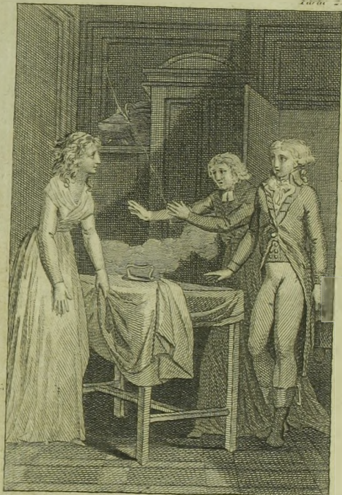
P. J. Chollon del.