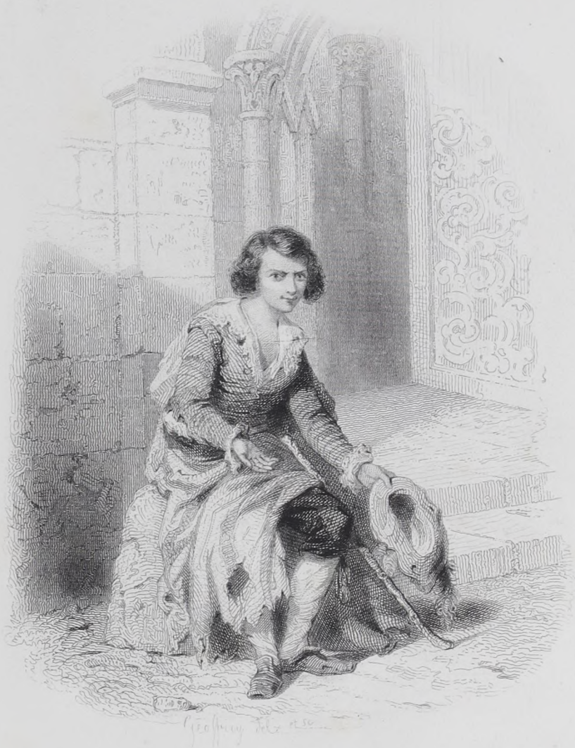
GUZMAN DE ALFARACHE