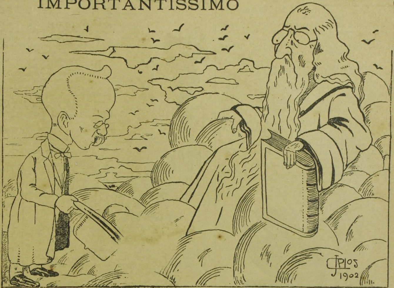
Consta que o Dr. Ruy Barbosa, foi ao paraíso solicitar a intervenção do Padre Eterno, na questão dos hydrometros.