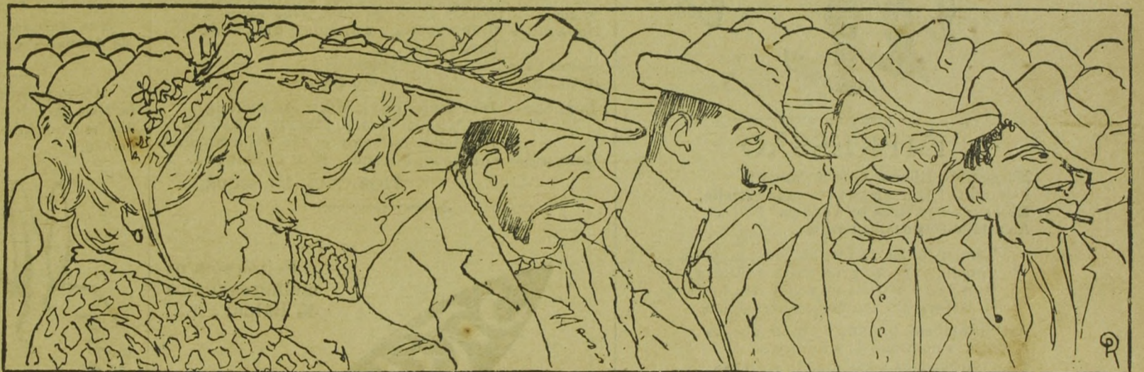
Os descontentes : Que fogo bota !