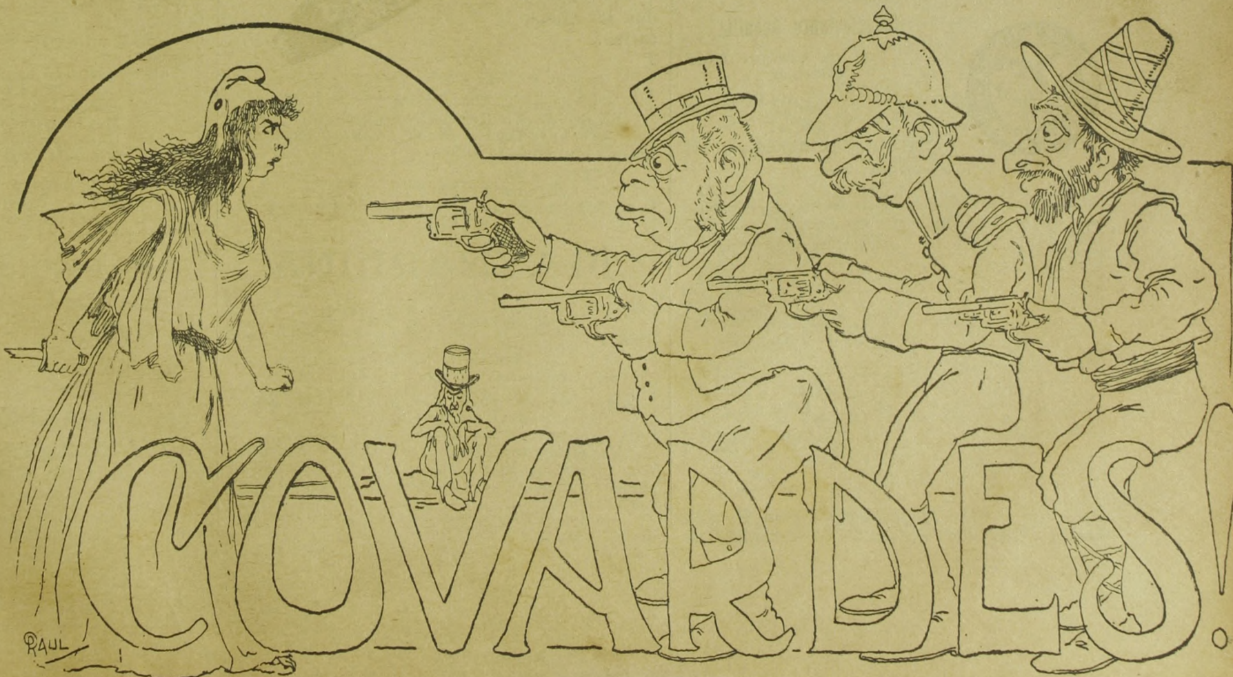
Tres contra um....