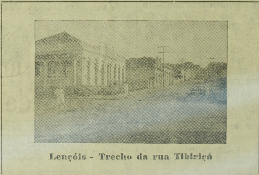
Lençóis - Trecho da rua Tibiriçá