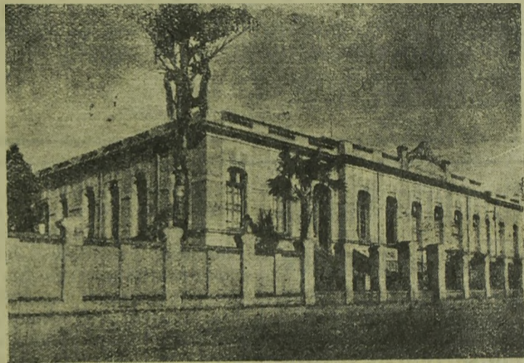
Fachada do Grupo Escolar de Lençóes.

Como se vê, dentro em breve, Lençóes terá mais esse importante melhoramento, graças ao esforço de um punhado de homens, dispostos a vencer as dificuldades que trouxe a lei do engarrafamento entre os nossos lavradores.