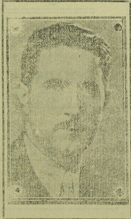
S. Excia. Dr. Adhemar de Barros

Afim de assistir aos festejos de inauguração do STADIUM PACAEMBU chegou a S. Paulo, ante-hontem, o presidente da Republica, sr. Getulio Vargas. S. E. chegou ás 11 horas, procedente de Araxá, viajando de avião.