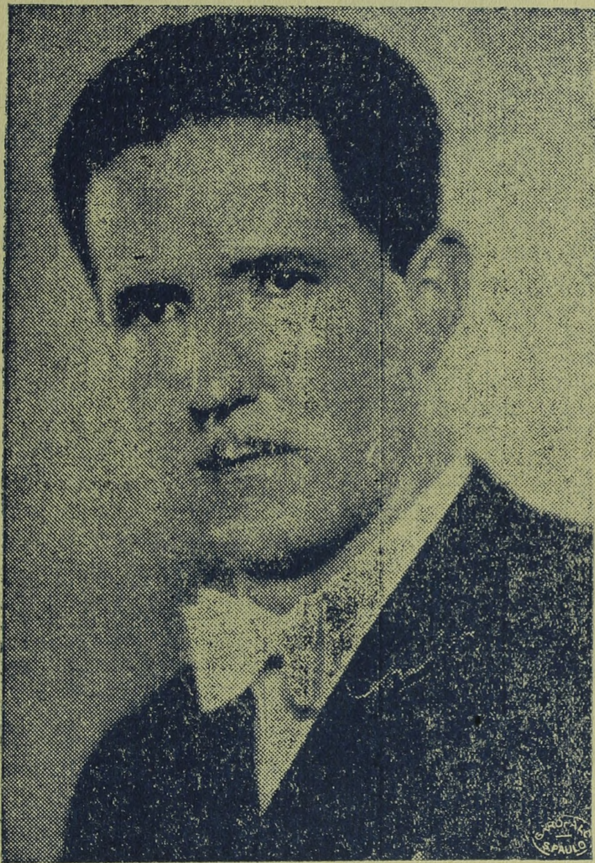
S. Excia. o Srr. Dr. Adhemar de Barros, illustre Interventor Federal em S. Paula, amigo numero 1 de Lençóes, que honja nos honra com sua visita.

Hoje é dia de festa para Lençóes. Temos a alta honra de receber a visita do eminente homem publico que rege os destinos da terra Bandeirante.