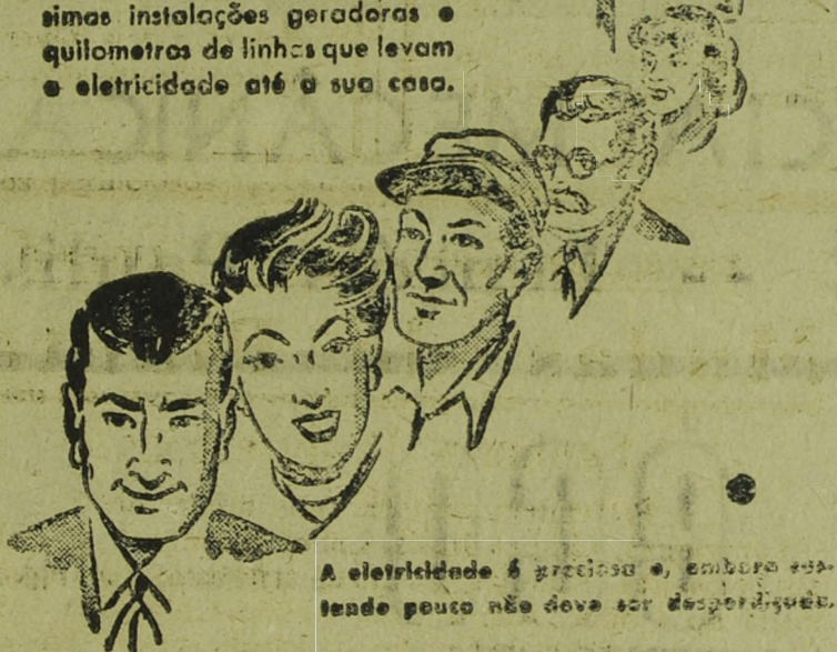
A eletricidade é preciosa e, embora estando pouco não deve ser desperdiçada.

Por trás do interruptor instalado em sua casa há uma completa organização dedicada a prestar-lhe o melhor serviço possível da eletricidade. Tal serviço resulta da conjugação de esforços de centenas de competentes empregados, da inversão de milhões de cruzeros e anos de planejamento e de estudos. Por trás do interruptor estão engenheiros, eletricitistas, instaladores, turmas de linha, detilografos, contadores, etc., e grandes somas de capital aplicadas em custosíssimas instalações geradoras e quilômetros de linhas que levam a eletricidade até a sua casa.