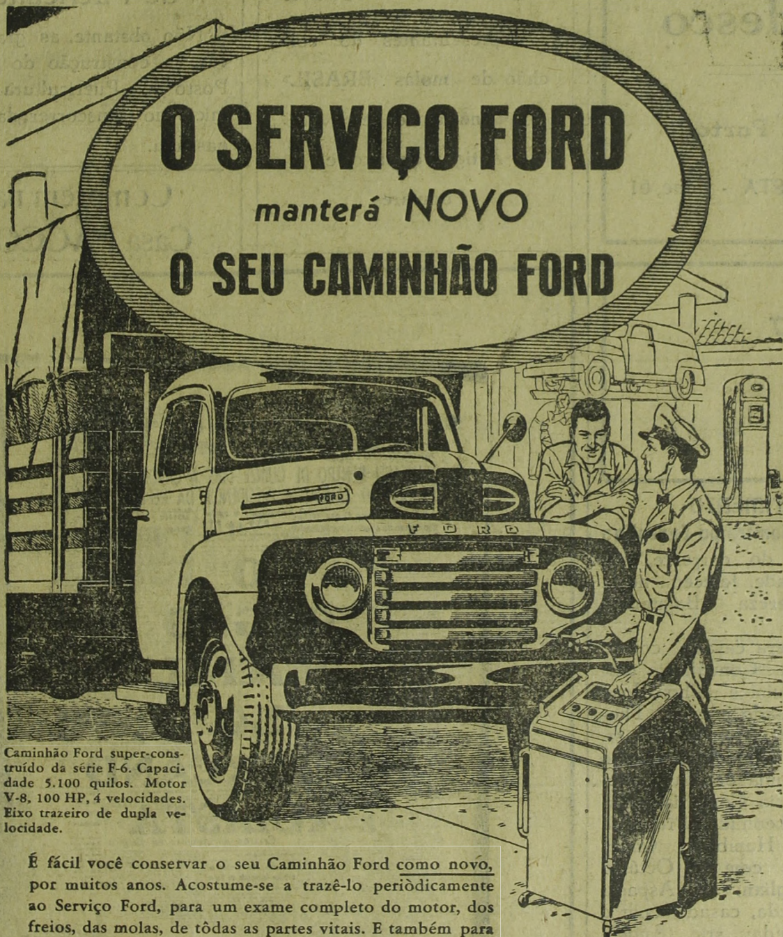
Caminhão Ford super-construído da série F-6. Capacidade 5.100 quilos. Motor V-8, 100 HP, 4 velocidades. Eixo trazeiro de dupla velocidade.

A Itália, nestas ultimas semanas tem vivido momentos agitados. A medida que se agrava a situação dos americanos na Coréia, os Estados Unidos, procuram, em conexão com a França e a Inglaterra, através do Pacto do Atlantico, recrutar um exército europeu para fazer frente a um possível ataque vindo da Rússia. Eisenhower foi encarregado dessa missão. E parece que uma parte do povo italiano não gostou. Sua presença na Itália foi motivo de grandes manifestações comunistas, buelminaram em choques sangrentos com a policia. Dezenas de operários ficaram feridos.