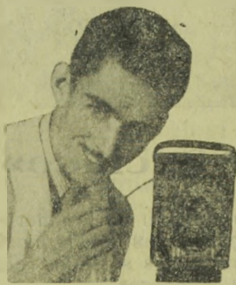
O SEU FOTÓGRAFO

Arte, Perfeição e Garantia Rua 15 de Novembro, 456 LENÇÓIS