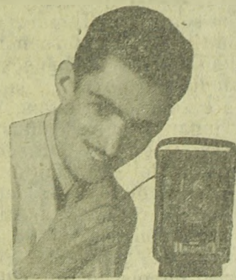
O SEU FOTÓGRAFO

Arte, Perfeição e Garantia Rua 15 de Novembro, 456 LENÇÓIS