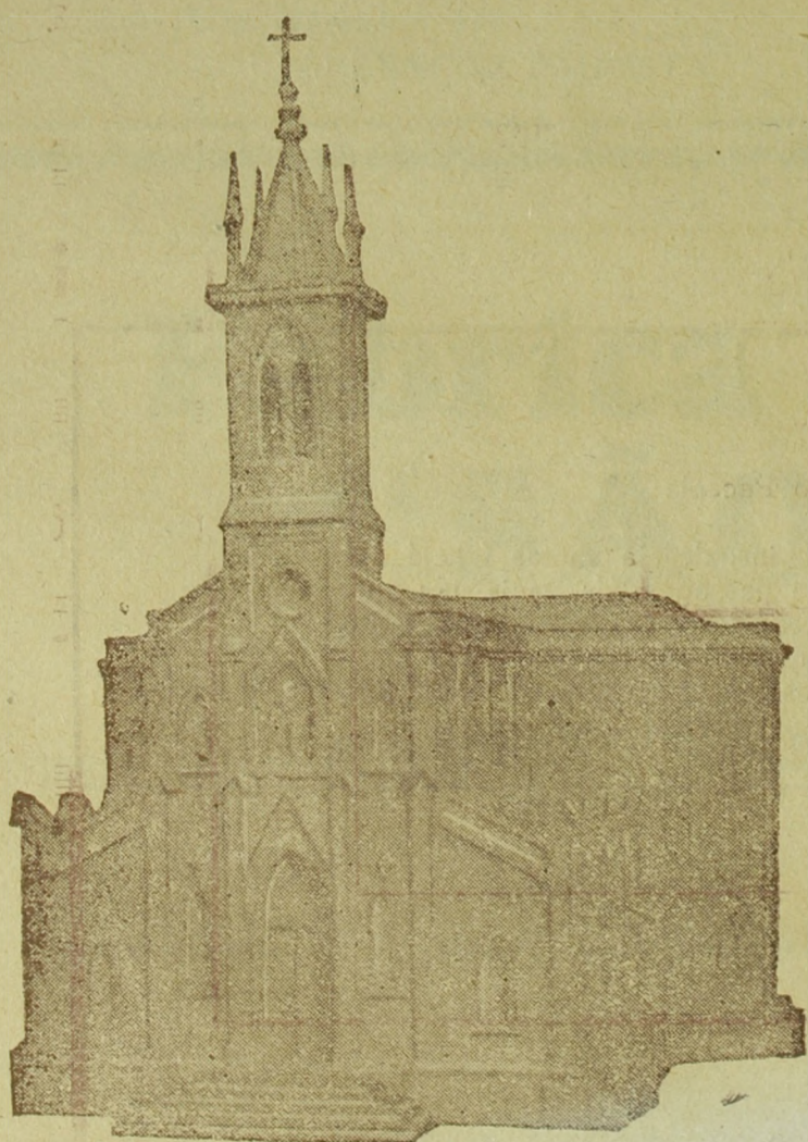
Nova Igreja Matriz, a inaugurar-se no dia 19 de Março vindouro.

Em 1952, os cofres públicos da União arrecadaram a elevadíssima soma de Cr$ . . . . . 7.338.048,40.