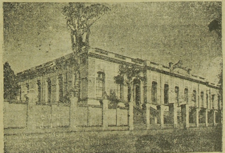
Prédio do Grupo Escolar «Esperança de Oliveira»