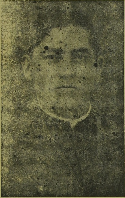
Pe. Salustio Rodrigues Machado

Depois de uma enfermidade que burlou todos os recursos da ciência médica, o revmo. vigário Pe. Salustio Rodrigues Machado, não resistindo a enfermidade, faleceu, às 23 horas, do dia 5 do corrente, na Santa Casa de Botucatu.