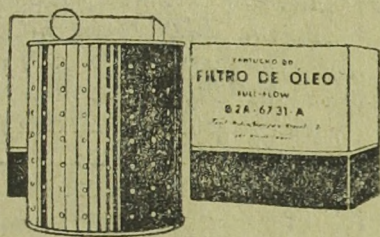
Cartuchos do Filtro de Óleo