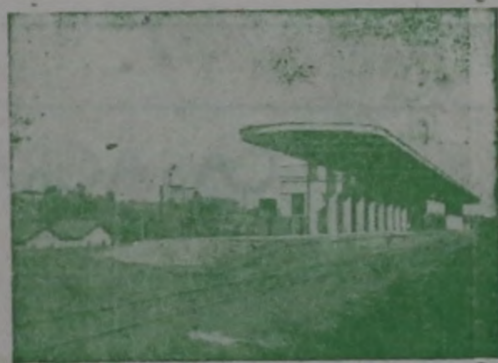
Estação da Estrada de Ferro Sorocubana

Segundo apuramos, os carros alegóricos do desfile de hoje estarão maravilhosos. Sobre o fato, falaremos na proxima edição.