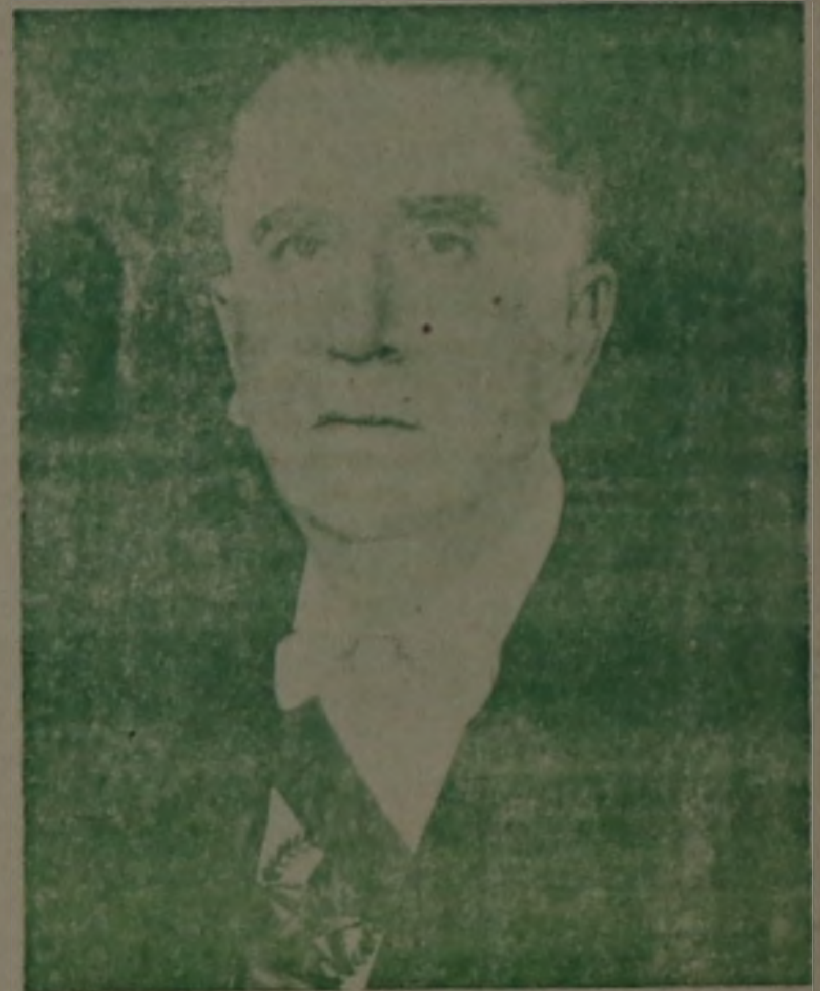
General Emilio Garrazu Médici Presidente da República