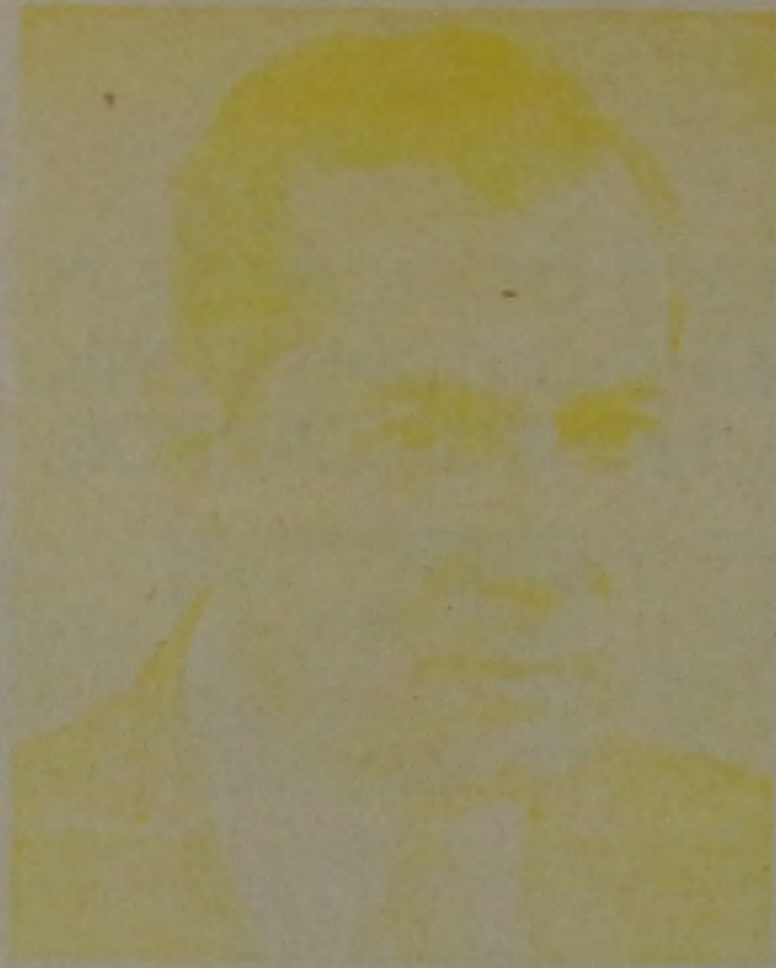
SR. UBALDO NATTA — Governador do Estado —