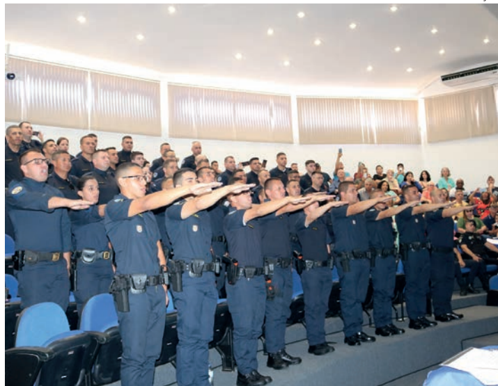
CAPACITAÇÃO - Candidatos aprovados no concurso também precisam passar por um curso de formação antes de exercer a atividade de GCM

Os interessados devem observar alguns requisitos básicos para a participação. Entre outras coisas, é preciso ter idade a partir de 18 anos (completa-