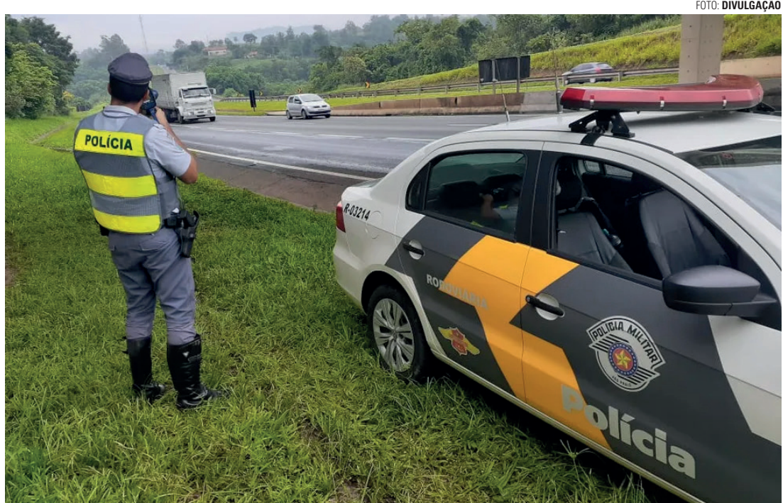
EVITÁVEIS - A maioria das infrações registradas nas rodovias paulistas remete ao excesso de velocidade

graves caiu 61,76% no mesmo período, de 34 em 2025 para apenas 13 neste ano. Consequentemente, também houve queda no registro de mortes, de 38 para 13 (-65,79%). Já a quantidade de feridos despencou 40,67%, de 627 para 372. Ainda segundo a Artesp, a maioria dos acidentes ocorreu entre a sexta-feira e o sábado, dias que registraram o tráfego mais intenso de veículos.