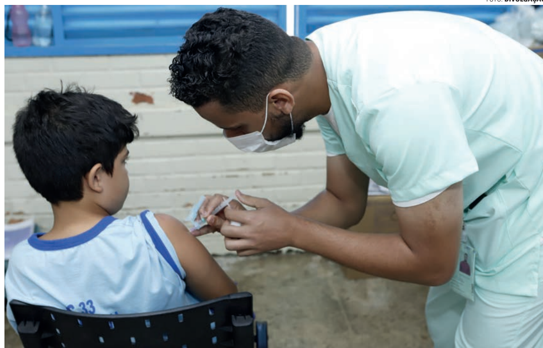
BUSCA ATIVA - Semana de Vacinação mobiliza equipes para atualizar a caderneta de crianças e adolescentes

“Com a vacinação nas escolas, estamos extinguindo a disciplina do negacionismo científico da educação básica. É a maior cobertura vacinal infantil dos últimos nove anos, atingindo um índice cinco vezes superior à média mundial. Isso é motivo de comemoração, mas não para que as escolas e as equipes de saúde da família baixem a guarda”, destaca o ministro da Saúde, Alexandre Padilha.